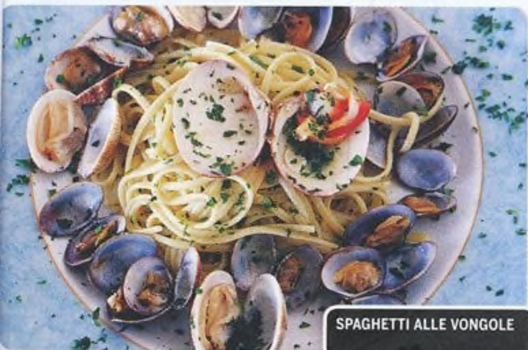
SPAGHETTI ALLE VONGOLE