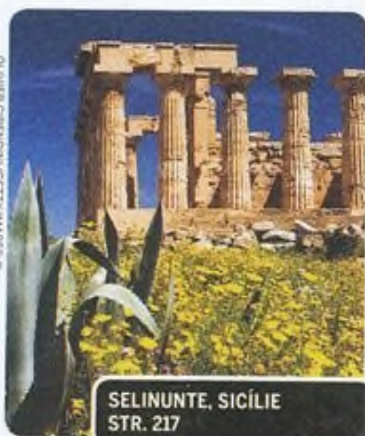
SELINUNTE, SICÍLIE STR. 217