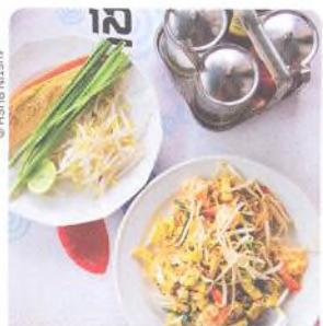
PÁT TAI: PRŮVODCE PO MÍSTNÍCH JÍDLECH STR. 726