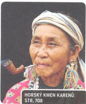
HORSKÝ KMEN KARENŮ STR. 708