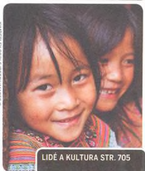
LIDÉ A KULTURA STR. 705