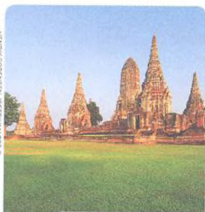
AYUTHAYA STR. 154