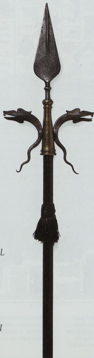
Francouzský doutnák z 18. st. – zápalník pro odpalování střílného prachu v dělech