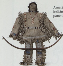
Americká indiánská panenka