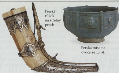
Perský růžek na střílný prach