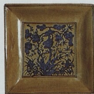
Čínský talíř z období dynastie Ming