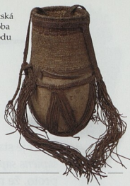
Egyptská nádoba na vodu