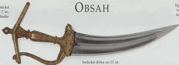
Indická dýka ze 17. st.