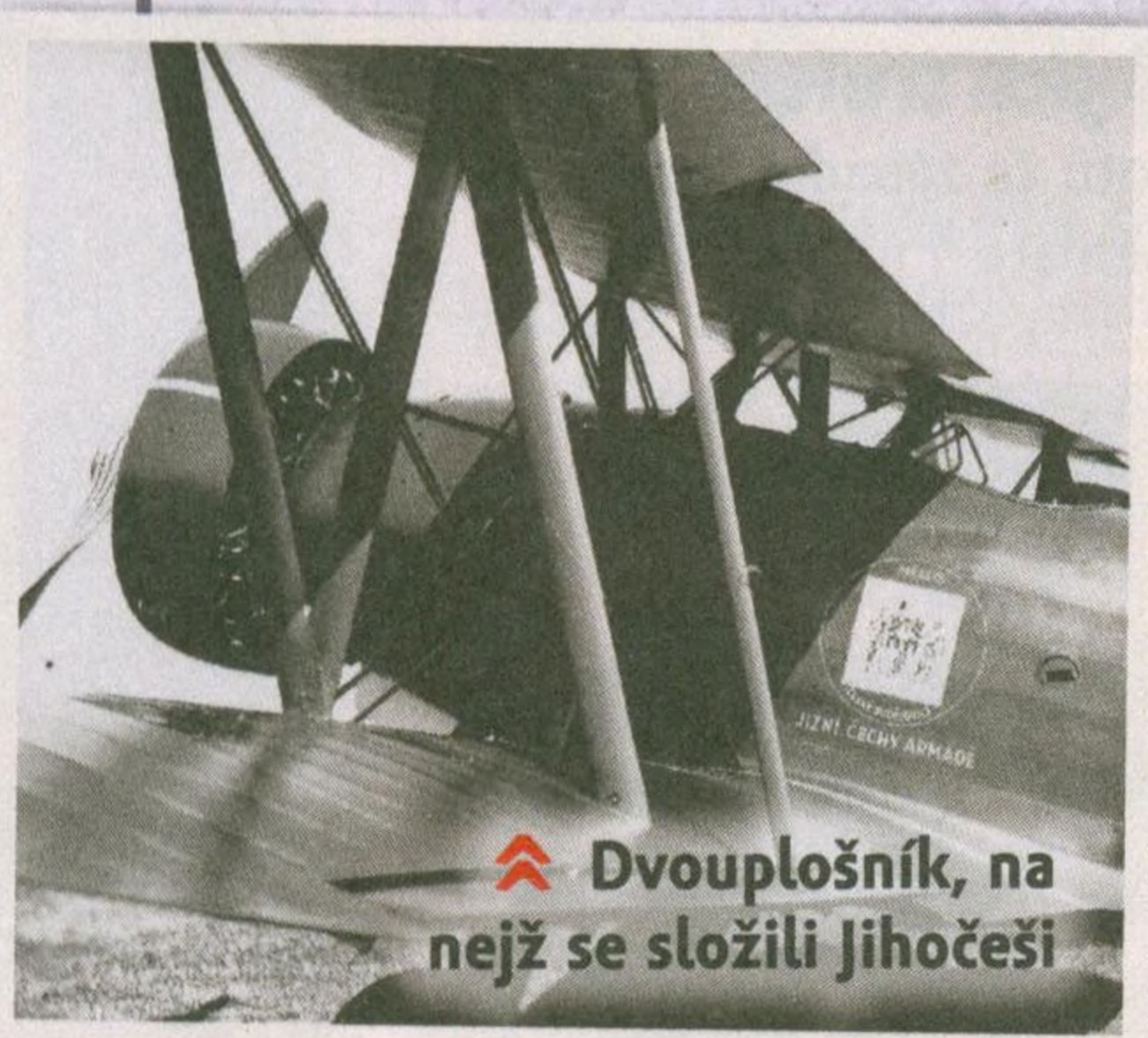
↗ Dvouplošník, na nějž se složili jihočeši

Vickersy Wellington naší 311. bombardovací perutě zahájily nálety na Říši a cíle v okupované Evropě. Zaznamenávaly těžké ztráty, a to i po celý rok 1941.