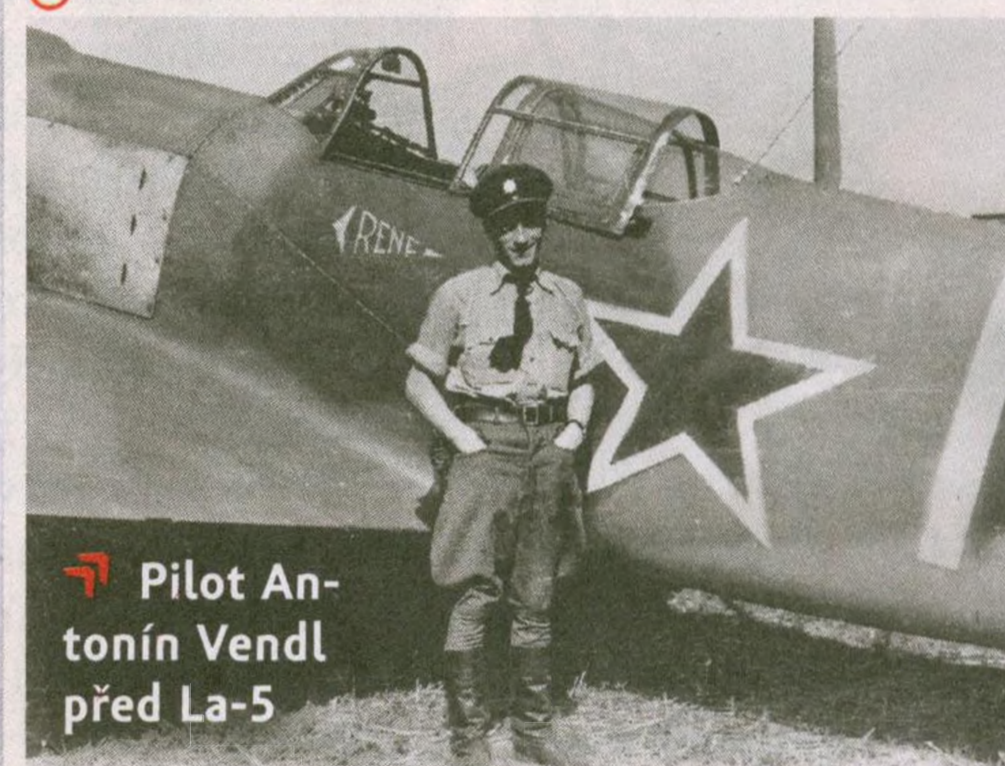
🚩 Pilot Antonín Vendl před La-5

Formace vytvořená z veteránů RAF vedená Františkem Fajtlem se přesunula na povstalecké území. Sestřelila devět strojů Luftwaffe a zničila řadu pozemních cílů.