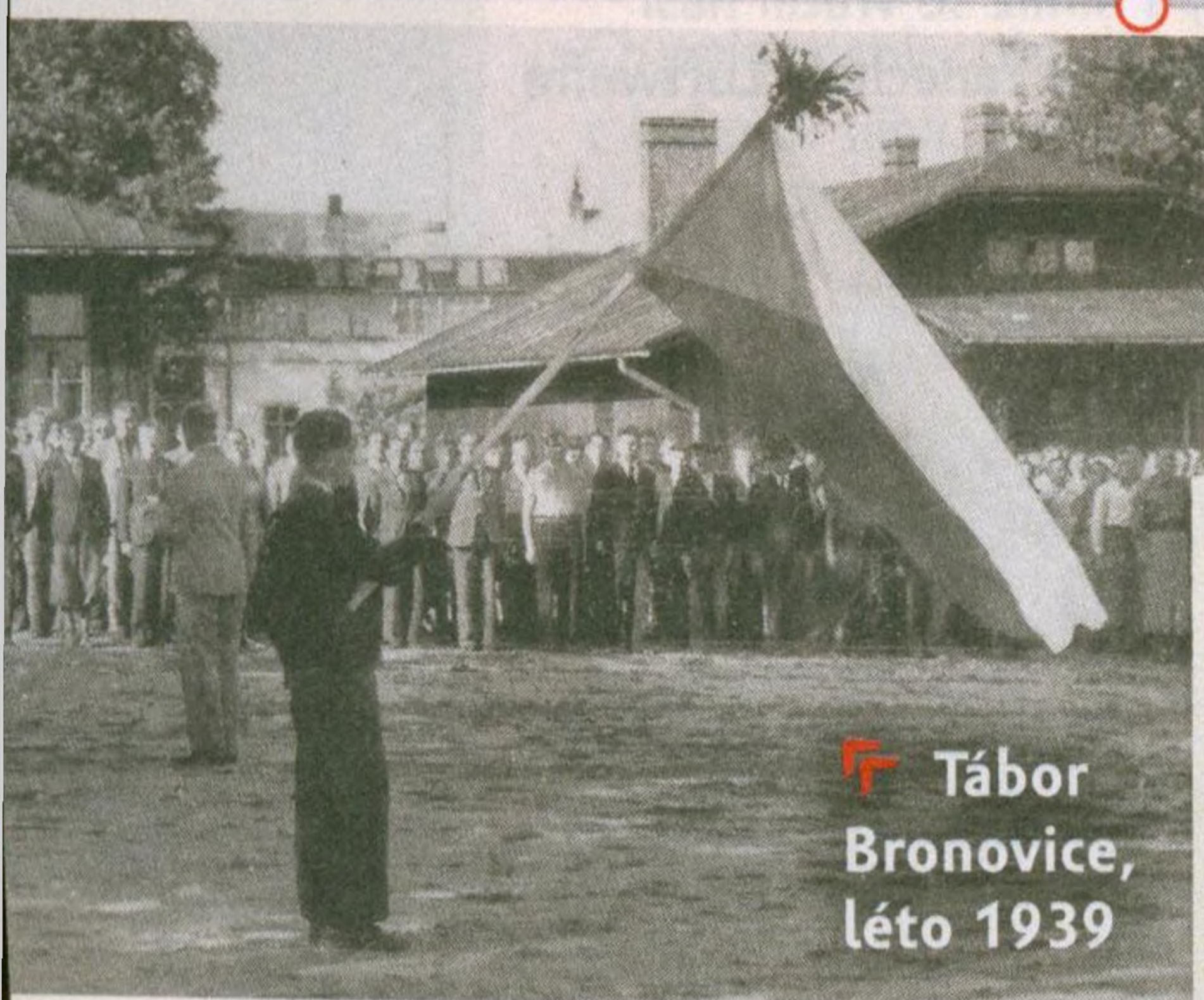
↳ Tábor Bronovice, léto 1939

Po okupaci zbytku republiky zaměřily stovky letců do Polska, na Balkán a Blízký východ s cílem bojovat za hranicemi. Většina se dostala do Francie.