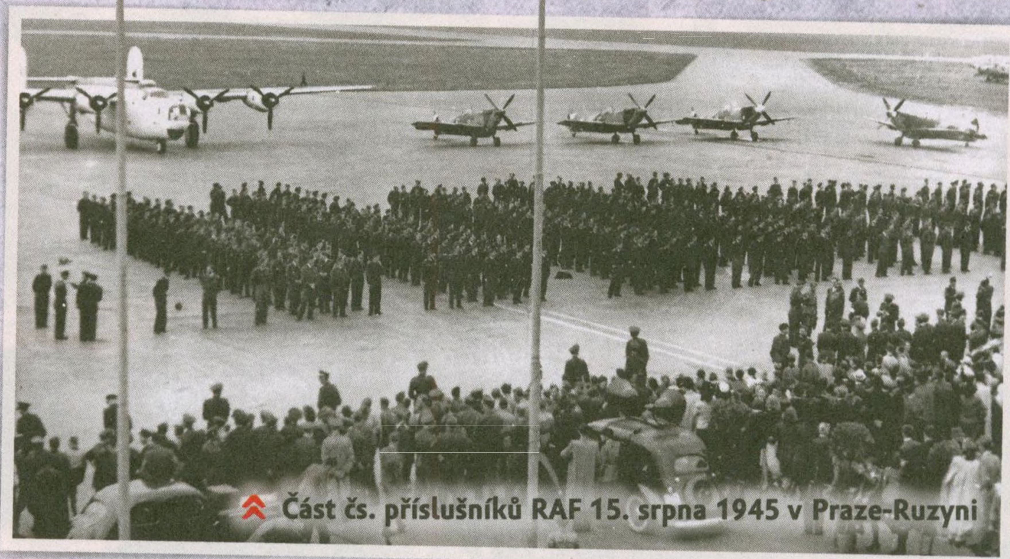
🚩 Část čs. příslušníků RAF 15. srpna 1945 v Praze-Ruzyni

Přílet perutí a čs. personálu domů se slavnostním přivítáním. Krátké období veřejného uznání a začátek budování nového letectva.