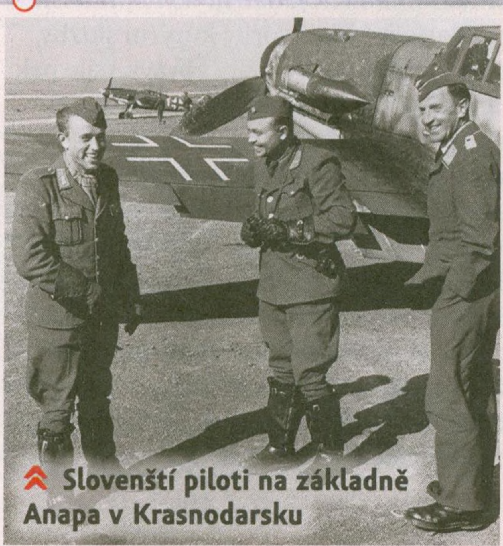
🚩 Slovenští piloti na základně Anapa v Krasnodarsku

Vzdušná jednotka Tisovy armády se účastnila bojů v sestavě eskadry JG 52 a na Kubáni sestřelila 216 sovětských letadel. Tři její členové dezertovali.