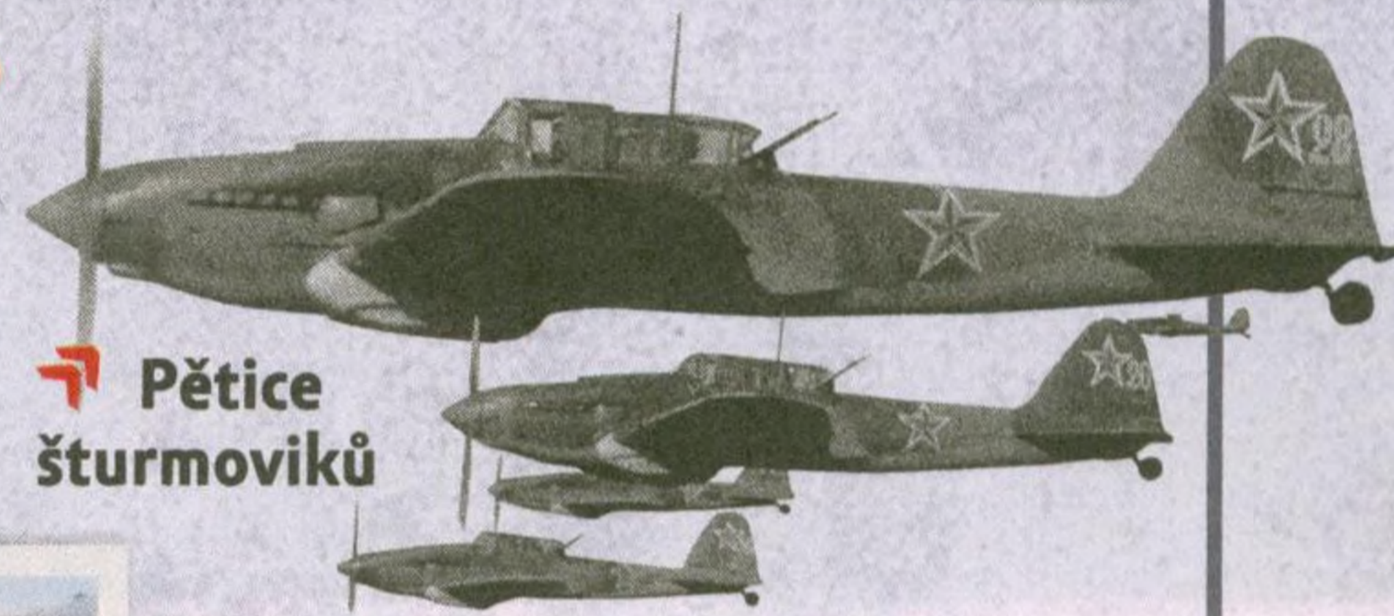
🚩 Pětice šturmoviků

Část slovenského letectva se zapojila do povstání. Vznikla provizorní jednotka s několika německými a zastaralými čs. stroji.