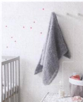
Pletená dečka 134