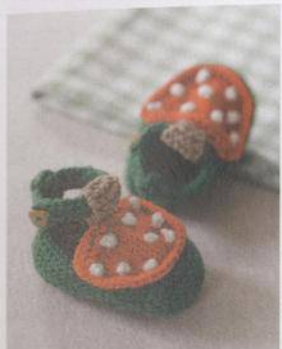
Podzimní botičky 128