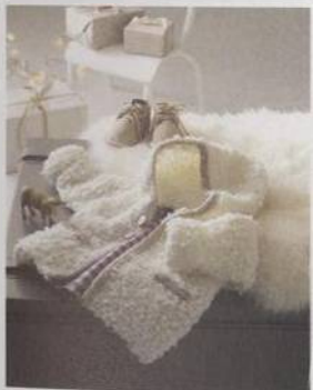
Nadýchaný kabátek s kapuckou 150