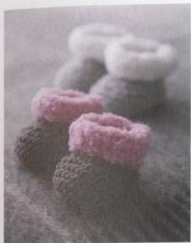
Bačkůrky pro zahřátí 52