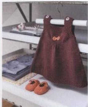
Letní šatičky s botičkami 130