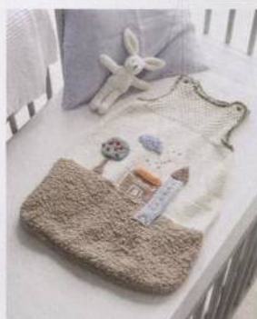
Spací pytel do kočárku 158