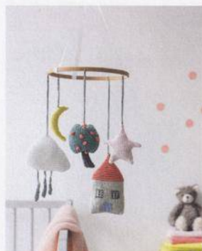
Závěsný mobil 108