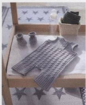
Kombinéza s copánkovým vzorem 142