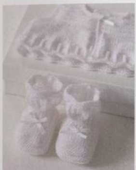
Slavnostní souprava 138