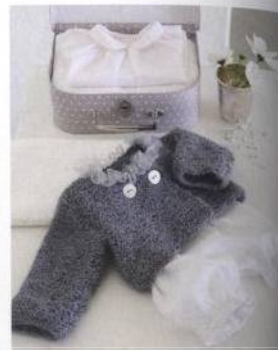
Sváteční svetřík 24