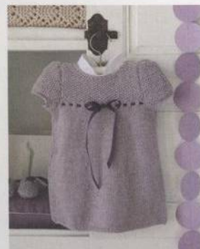
Šatičky s fialovou stužkou 38