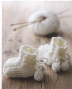
Zimní bačkůrky 96