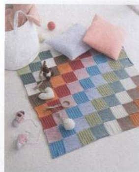
Dečka z barevných čtverců 60