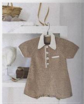
Kombinéza a čepice pro malého pilota 124