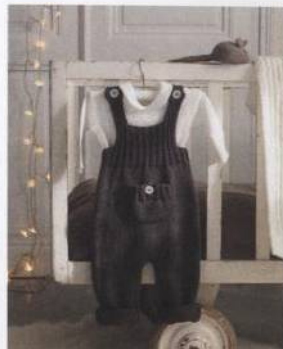
Kalhotky s laclem 136