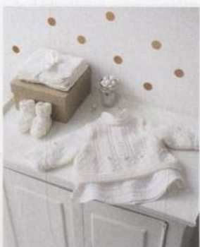
Kabátek ke křtu 84