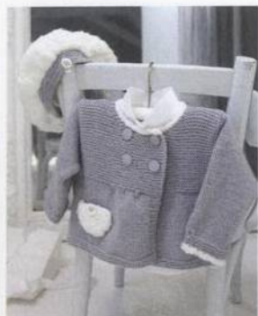
Kabátek a bareť s beránky 54