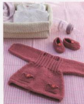
Růžové šatičky s kvítky 32