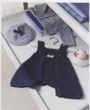
Souprava s mašličkami 80