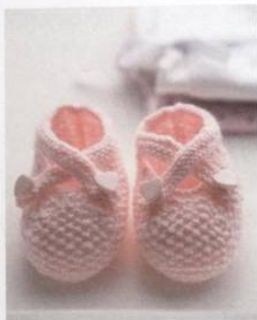
Botičky s překříženými pásky 16