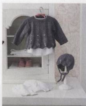
Tunika s flitry 88