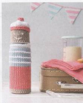
Termoobal na kojeneckou lahvičku 30