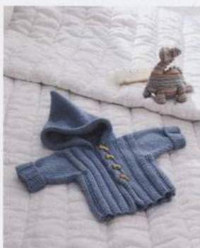
Rybářská bundička 146