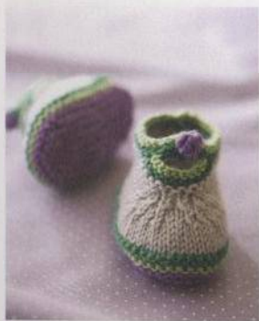
Jarní botičky 114