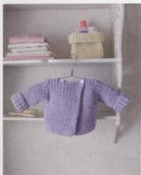
Asymetrický kabátek 104