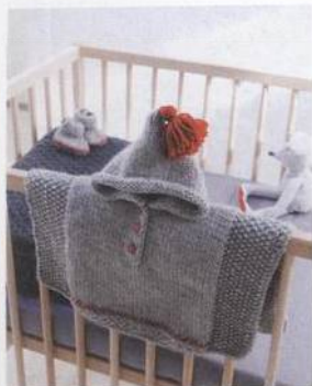
Pončo na deštivé dny 92