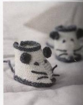
Bačkůrky myšičky 36