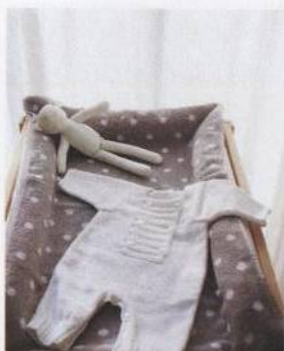
Overal na spinkání 70