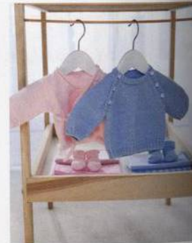
Dvojčátka na obzoru? 48