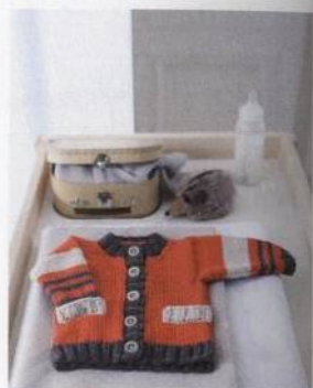
Svetr pro malého sportovce 112