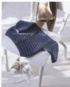
Vesta s malými medvídky 58