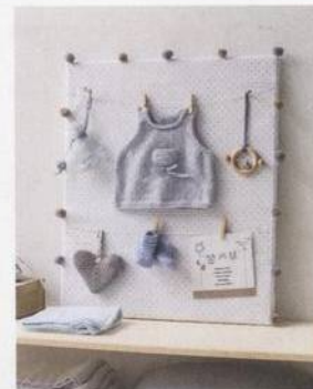
Nejdražší suvenýry 44