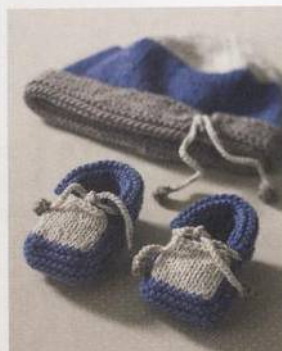
Botičky a čapka pro malého námořníka 26