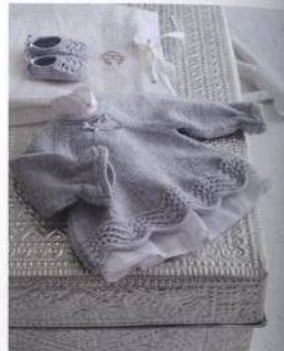
Luxusní záležitost 100