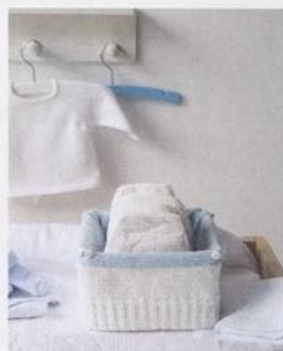
Košík na plenky 148