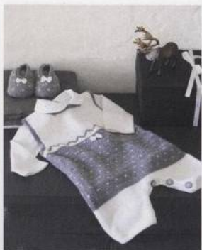
Zimní obleček 116