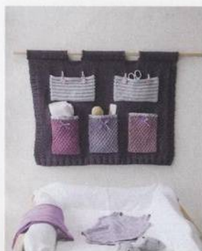
Kapsář pro maminku 122