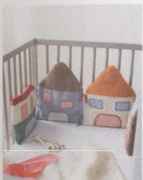
Postýlka na návsi 64