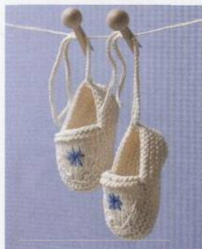
Střevíčky na prázdniny 106