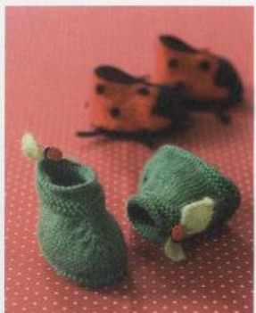
Bačkůrky od Petra Pana 68