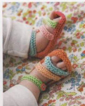
Letní sandálky 42