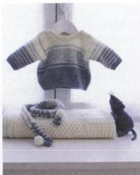
Svetřík a šálka 18