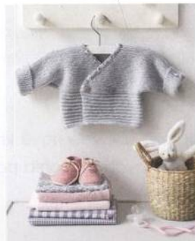
Vestička s lemváním 22