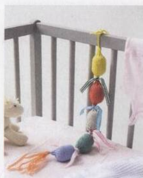
Pletené chraštítko 74