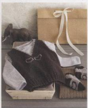
Vestička malého studenta 152