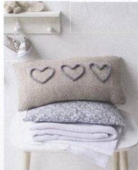
Polštář se srdíčky 98