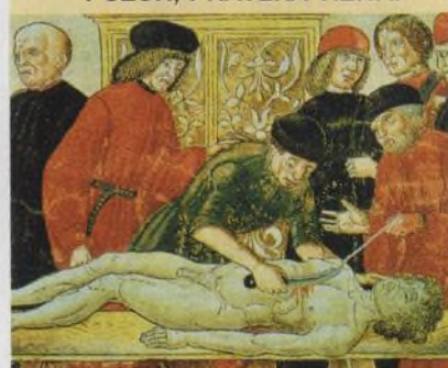
Chirurgie v dobách předpotopních

44 ZAŽIJÍ OKNA REVOLUCI? K čemu pomohou nanokrystaly?