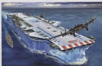
Jak fungovala Goliášova ruka či Větroplach?

68 BLÁZNVITÉ ZBRANĚ A ŠÍLENÉ VOJENSKÉ PROJEKTY