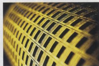
V Berkeley vzniká umělá multifunkční kůže

92 PŘIPRAVTE SI KOŽICHY I ZÁSoby VODY Jak se projevuje globální oteplování Země?