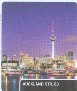
AUCKLAND STR. 63