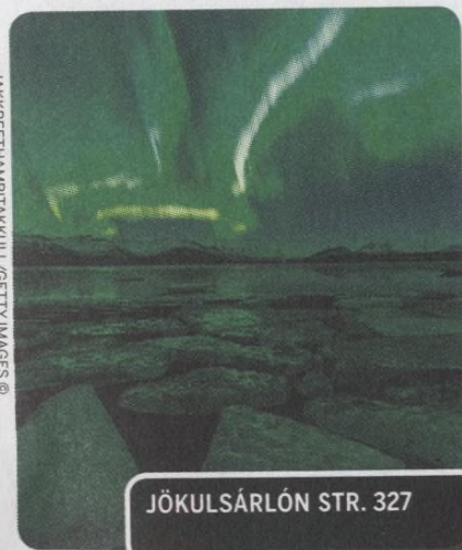
JÖKULSÁRLÓN STR. 327