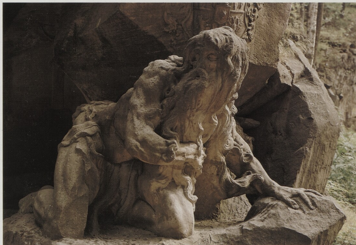
4. Matyáš Bernard Braun, sv. Jůda Tadeáš, 1712, Národní galerie, Praha (str. 4); Garinus, kol. r. 1720, Betlém u Kuksu (str. 7).