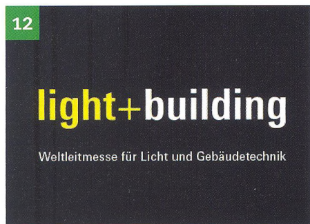
Light + Building 2018