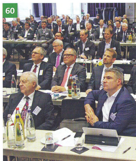
Die TGA als Buhmann?