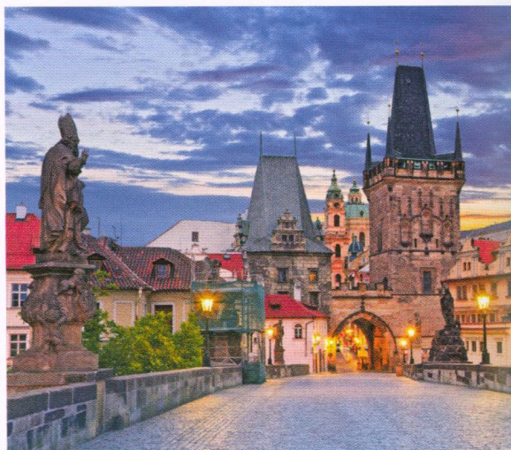
Podvečerní pohled z Karlova mostu na Malou Stranu

Nakladatel se snažil, aby všechny informace obsažené v této knize byly v době jejího tisku aktuální. Některé údaje, například telefonní čísla, otevírací doby, ceny, uspořádání expozic v galeriích a informace o dopravě, však podléhají změnám. Nakladatel není odpovědný za žádné důsledky, které vznikly používáním této knihy.