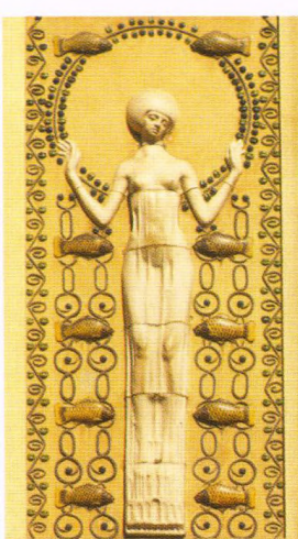
Detail na secesním domě v Kaprové ulici ve čtvrti Josefov