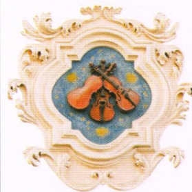
Barokní prvek tří houslí na průčelí domu