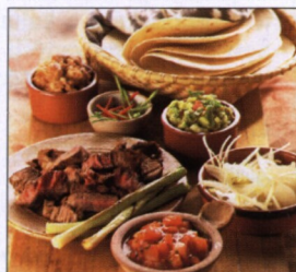
Carne asada , pikantní grilované maso, je typické mexické jídlo