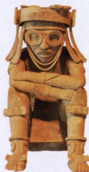
Socha Tlaloka, Museo de Antropologia ve Xalape