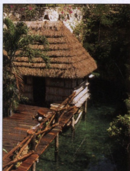
Mayská vesnice v tematickém parku Xcaret na pobřeží poloostrova Yucatan