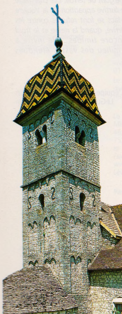
Impérial sous son dôme, le clocher de Boussières n'oublie pas ses origines romanes.