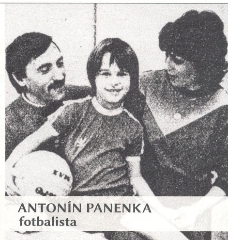
ANTONÍN PANENKA fotbalista

„Už odmala jsem hopsal. Byl jsem taková opička. Doma jsme pořád roztahovali gauč a zkoušeli kotrmelce a salta. První salto vzad jsem udělal v šesté třídě na základce.“