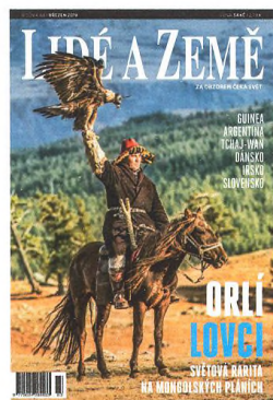
Na obálce: Orlí lovci v Mongolsku pohledem Vaška Šilhy, str. 14

112 HOTEL SNŮ Noc ve slavné Desavě: oslavte 100 let Bauhausu