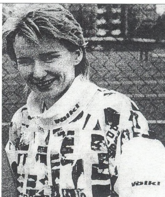
JANA NOVOTNÁ tenistka

„Nechci říkat, že jsou věci mezi nebem a zemí, to je strašné klišé. Vždycky se mi otvírá kudla v kapse, když to slyším. Ale mně samotnému se přihodilo několik nevysvětlitelných zážitků.“