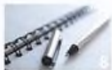
table des matières obsah