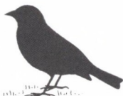
vrabec domový 15 cm/30 g