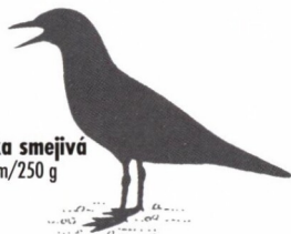
čajka smejivá 36 cm/250 g