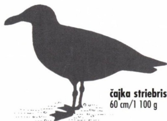
čajka striebriстая 60 cm/1 100 g