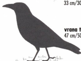
vrana túlavá 47 cm/500 g