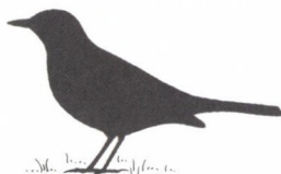
drozd čierny 25 cm/90 g