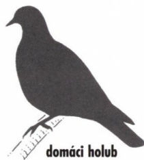
domáci holub 33 cm/300 g