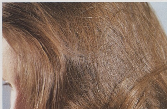
Nový barevný tón dodá vlasům nový lesk