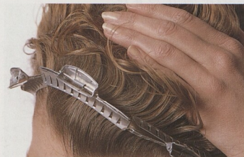
Dá se naučit: používání skřipců, natáček, fěnu atd.