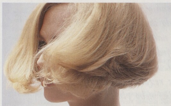
Klasický příklad stále moderního účesu: pážecí střih