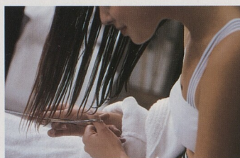
Ostříhat se sama? Když už, tak profesionálně