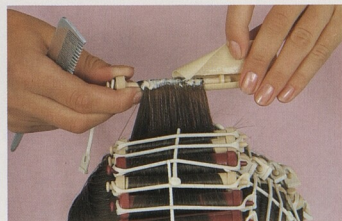
Trvalá: nejlepší způsob, jak udělat z mála vlasů hodně