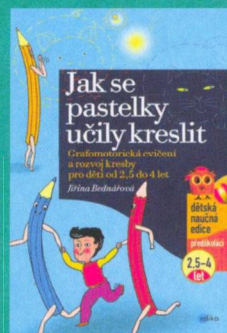
Jiřina Bednářová, Jak se pastelky učily kreslit

vydává další knihy k rozvoji kreslení a psaní dítěte: