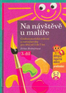
Jiřina Bednářová Na návštěvě u malíře