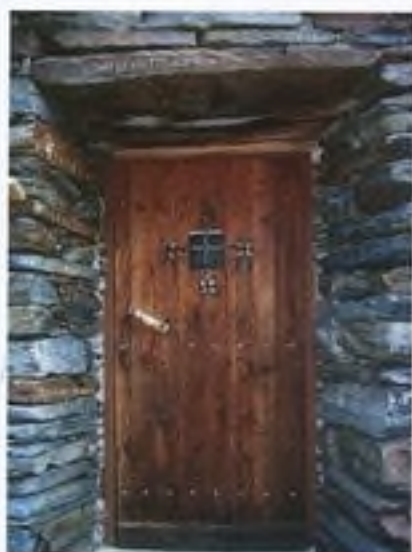
Chata Schäferhütte na výstupu k chatě Martin-Busch-Hütte (túra 10)