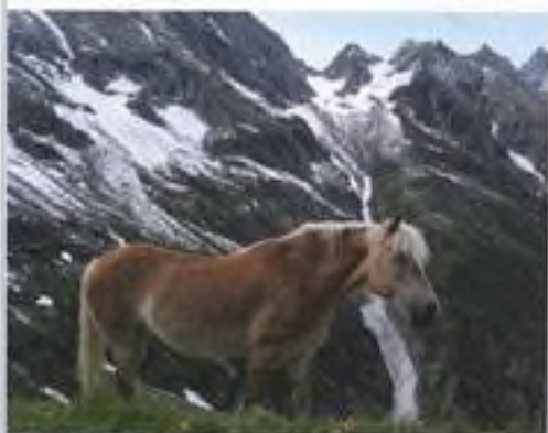
Hafllinský kůň na chatě Greizer Hütte (túra 22)