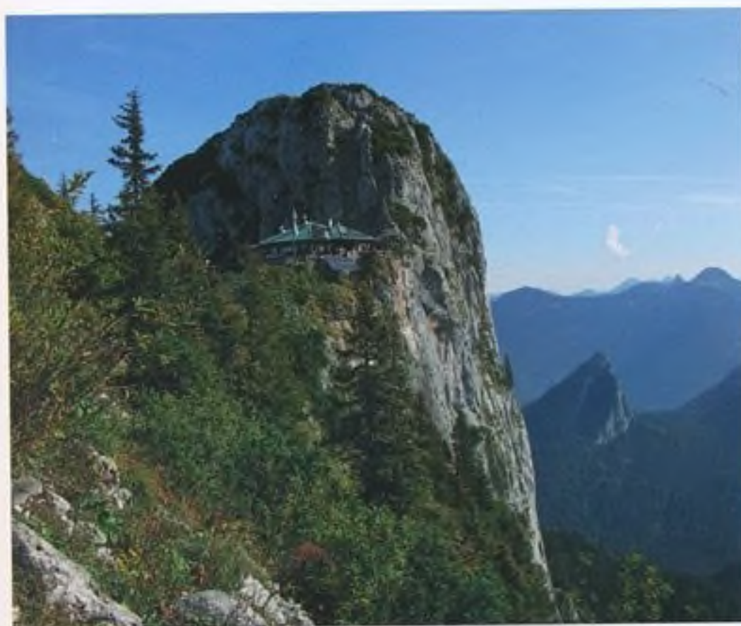
Chata nad jezerem Tegernsee a Buchstein (túra 18)