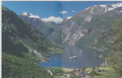
Pohled na Geirangerfjord