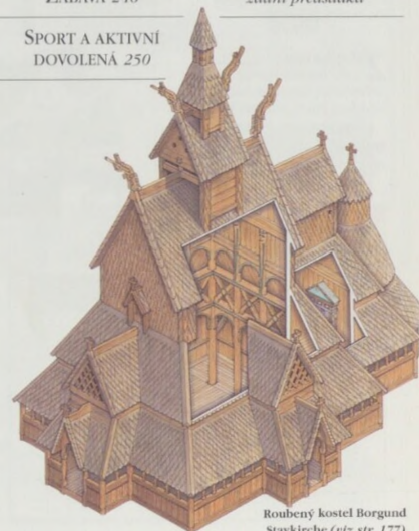
Roubený kostel Borgund stavekirke (viz str. 177)