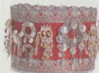
Svatební korunka z Hallingdalu (viz str. 24–25)