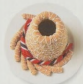
Kransbake – slavnostní mandlový zákusek