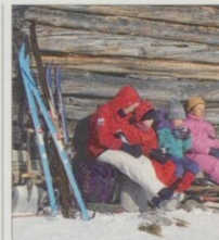
Lýžaři odpočívají u srubu v Trysilu, východní Norsko