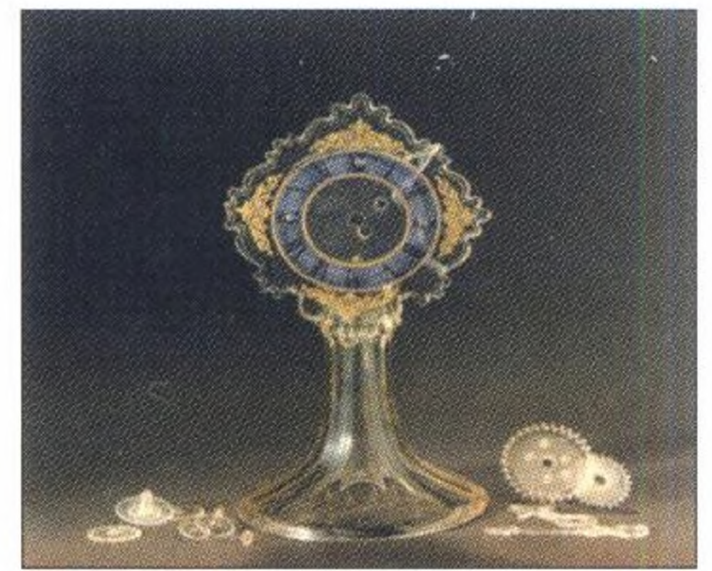
Gläserne Uhren, Seite 8