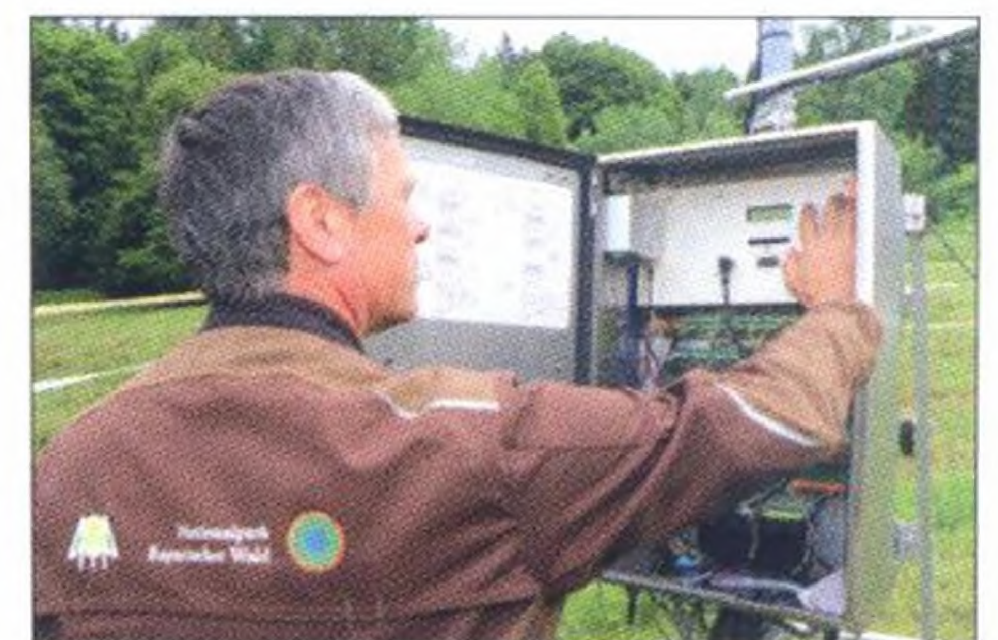
Drittwärmstes Jahr, Seite 32