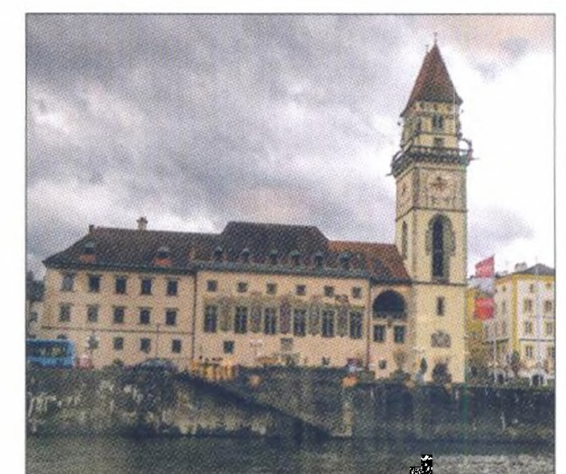
Ausflug nach Passau, Seite 34