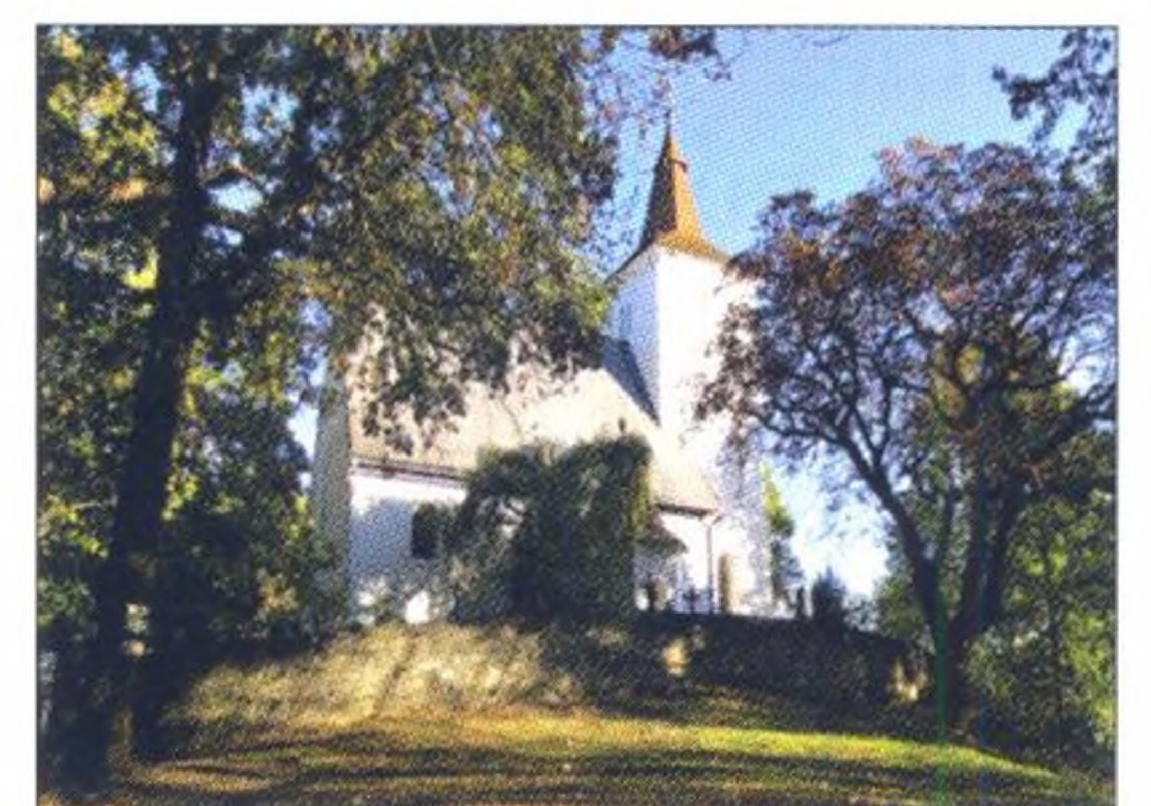
St. Maurenzen, Seite 15