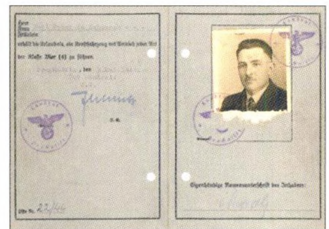
Ältester Führerschein, Seite 7