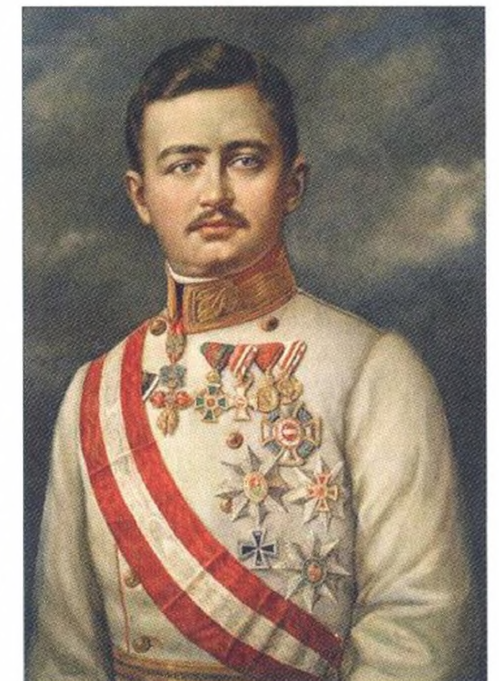
Der letzte Kaiser Seite 17