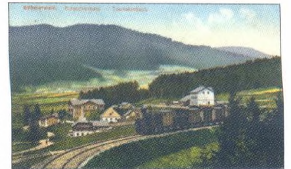
Ein Kinderschicksal in Lenora Seite 8