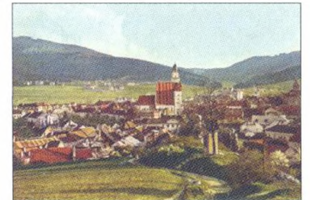
Geschichte der Mäd- chen-Volksschule in Prachatitz Seite 11