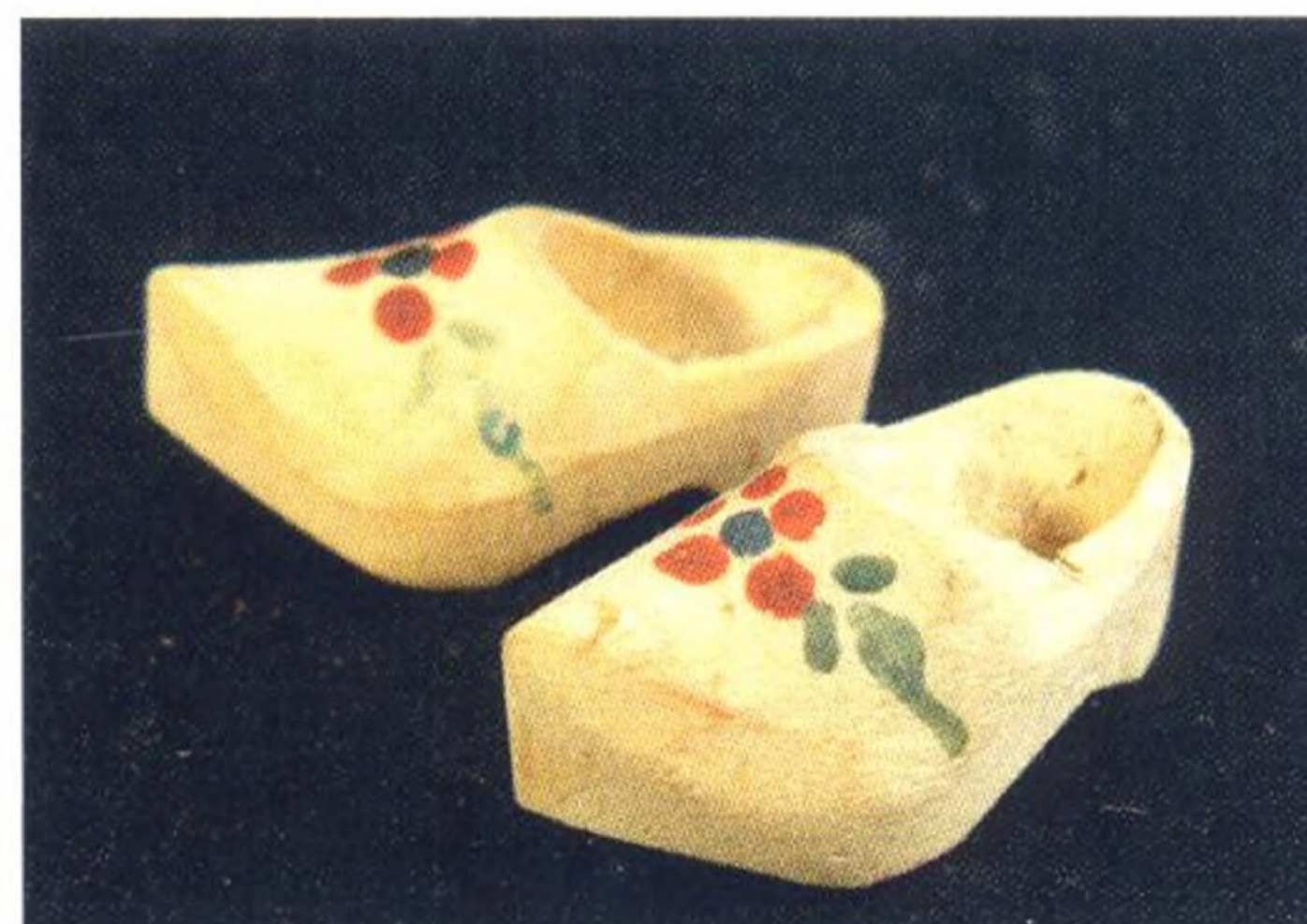
Holzschühchen erzählen Geschichte Seite 27