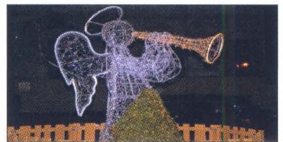
Adventzeit in Prachatice, Seite 14