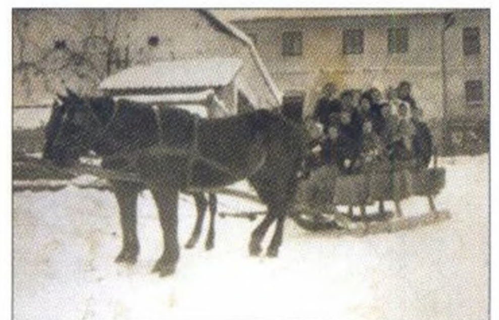
Erinnerungen an die Vorweihnachtszeit 1944, Seite 17