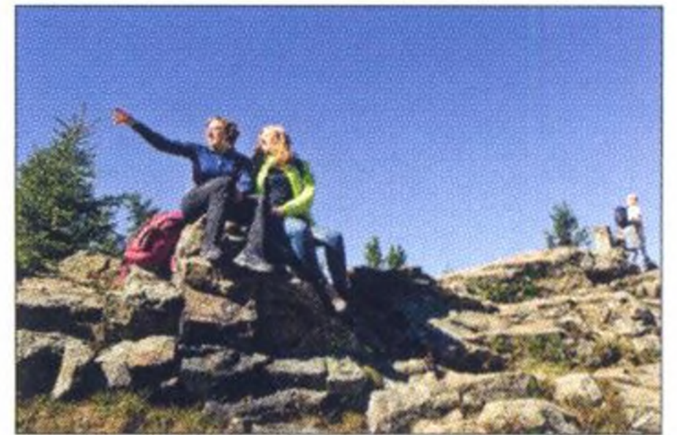
Fotowettbewerb, Seite 10