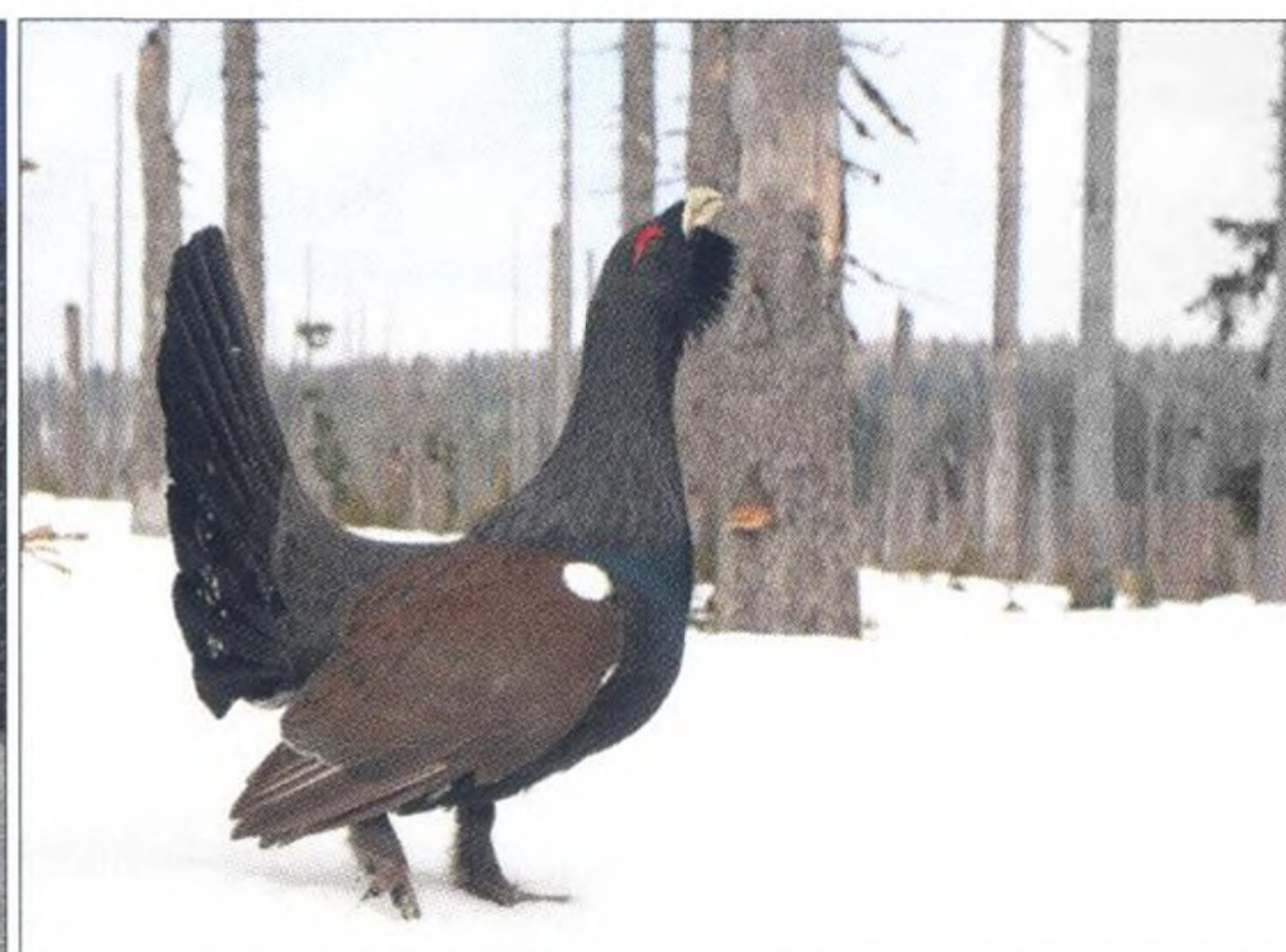
Langlaufen im Böhmerwald und Auerhuhn-Schutz, Seite 28