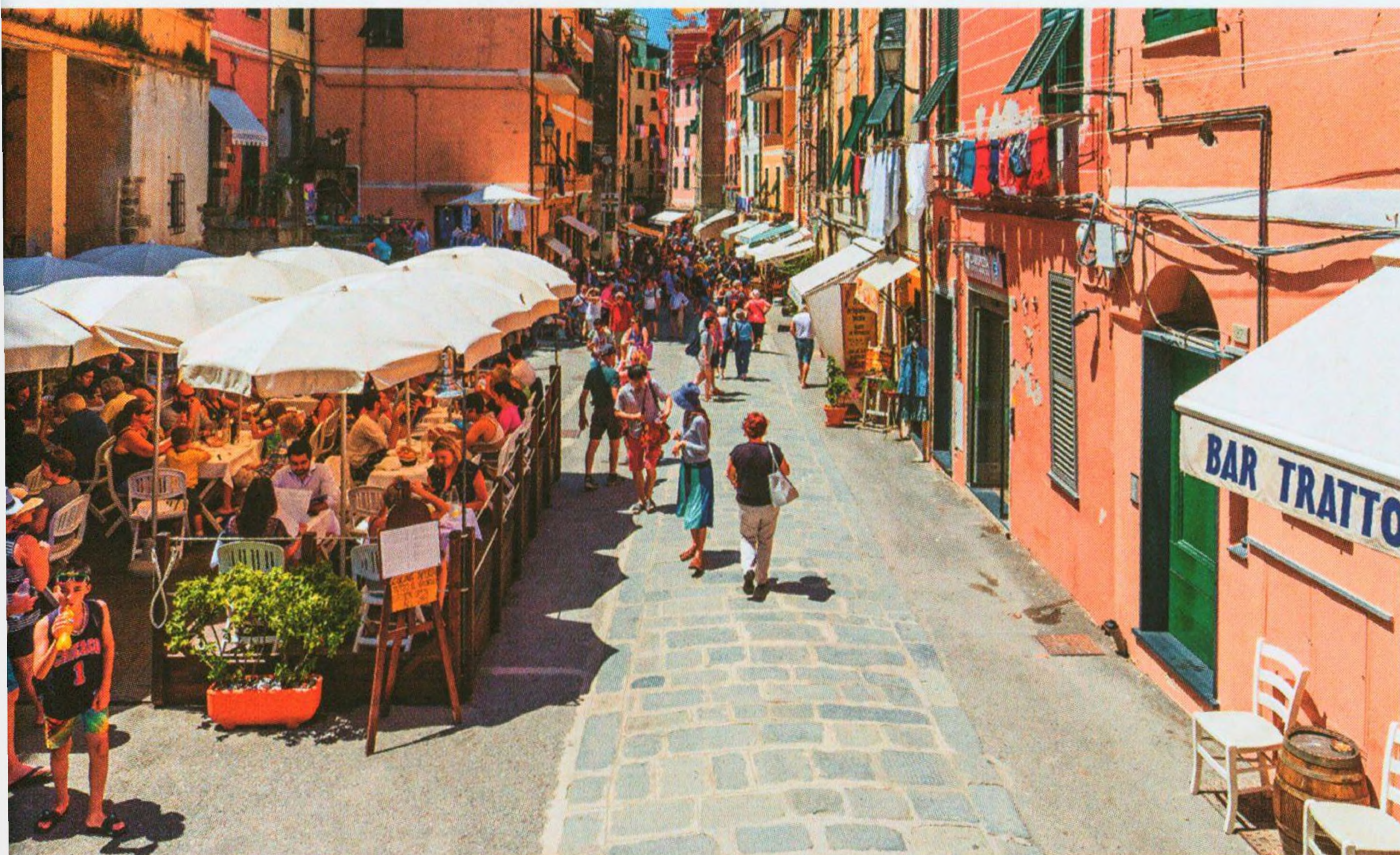
Vernazza, Cinque Terre (str. 72)