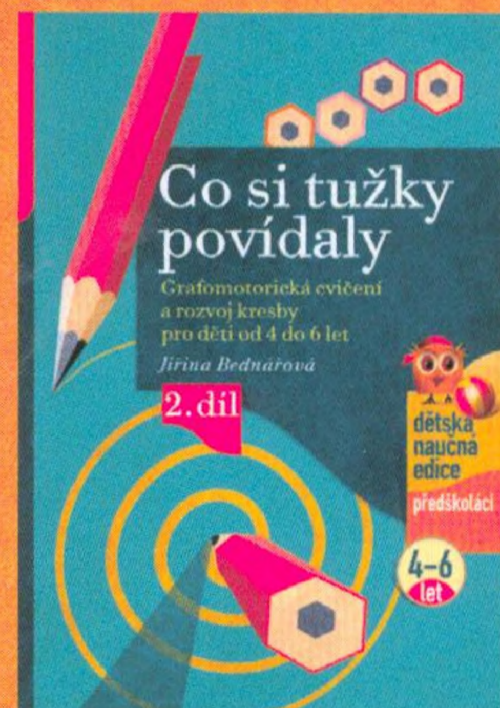
Jiřina Bednářová Co si tužky povídaly

Další knihy k rozvoji kreslení a psaní dítěte: