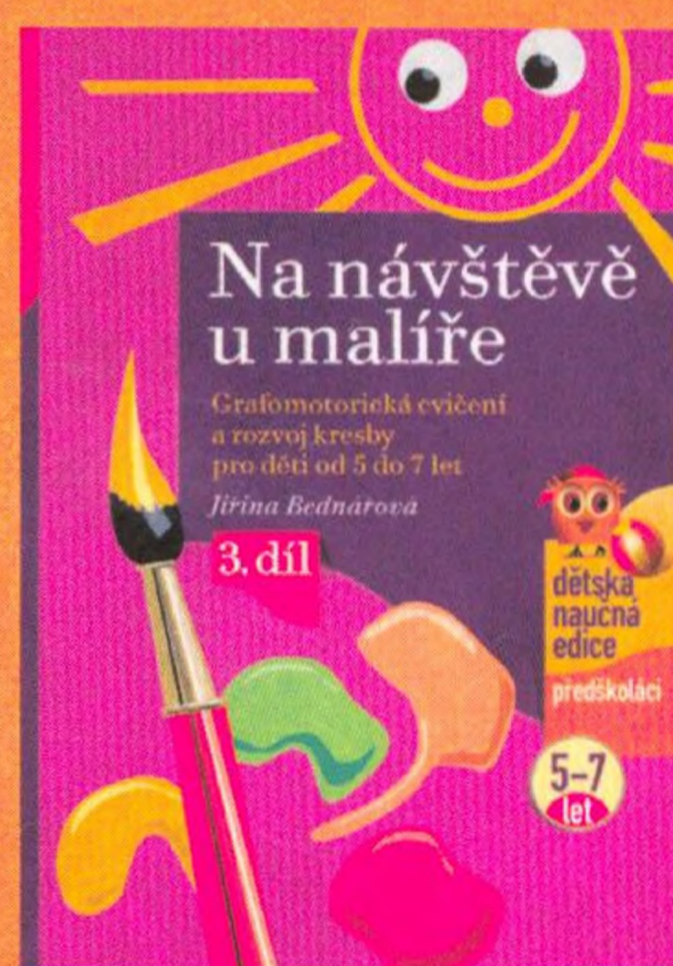
Jiřina Bednářová Na návštěvě u malíře