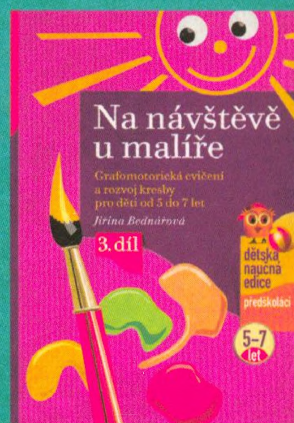
Jiřina Bednářová Na návštěvě u malíře