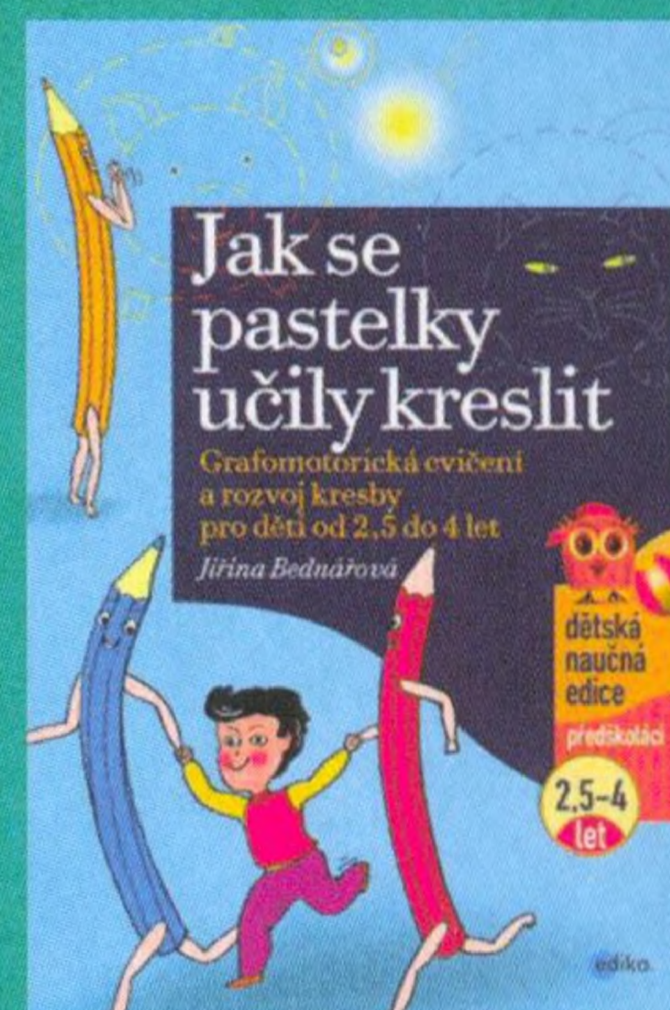
Jiřina Bednářová, Jak se pastelky učily kreslit

vydává další knihy k rozvoji kreslení a psaní dítěte: