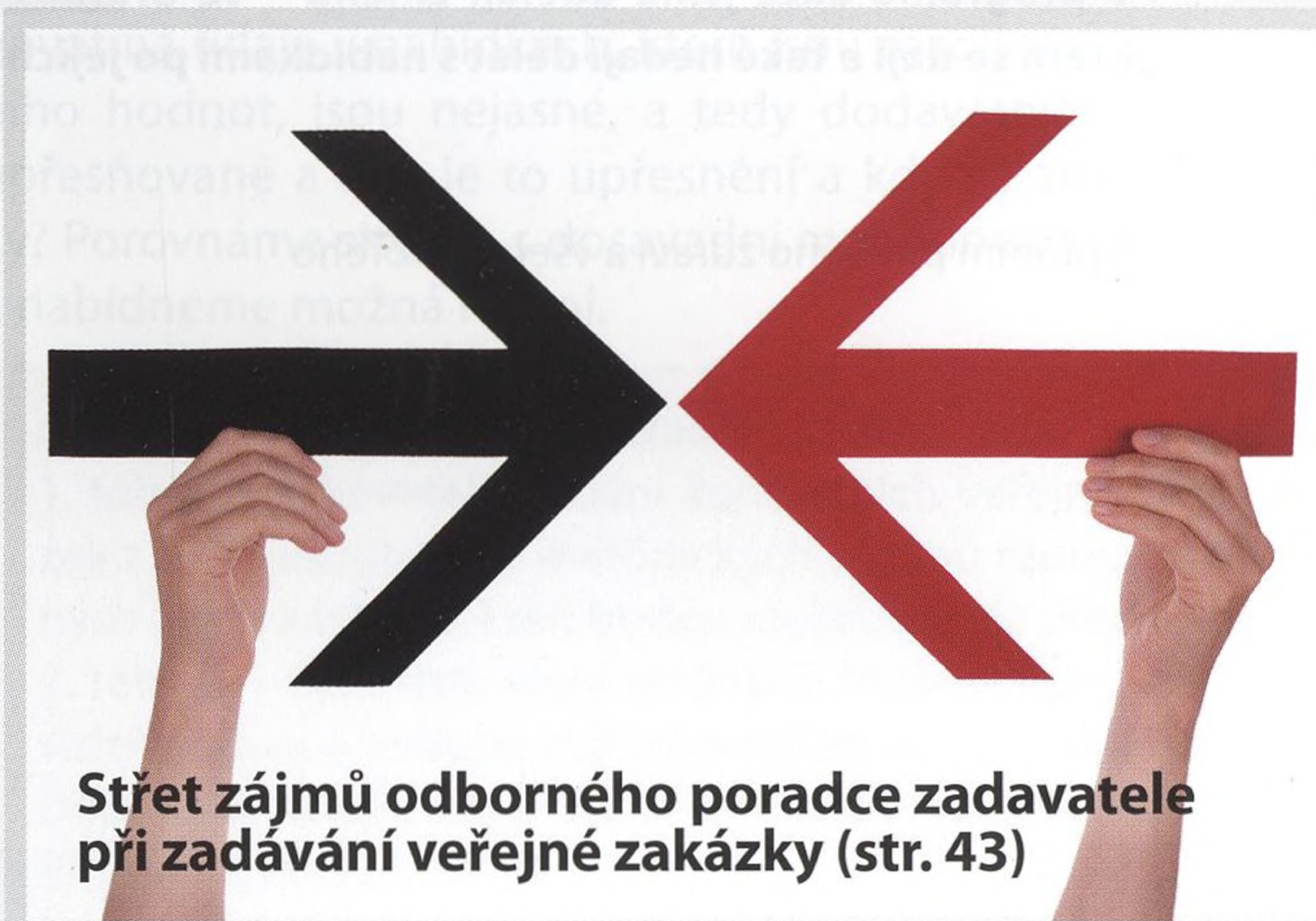
Střet zájmů odborného poradce zadavatele při zadávání veřejné zakázky (str. 43)

Střet zájmů odborného poradce zadavatele při zadávání veřejné zakázky ..... 43