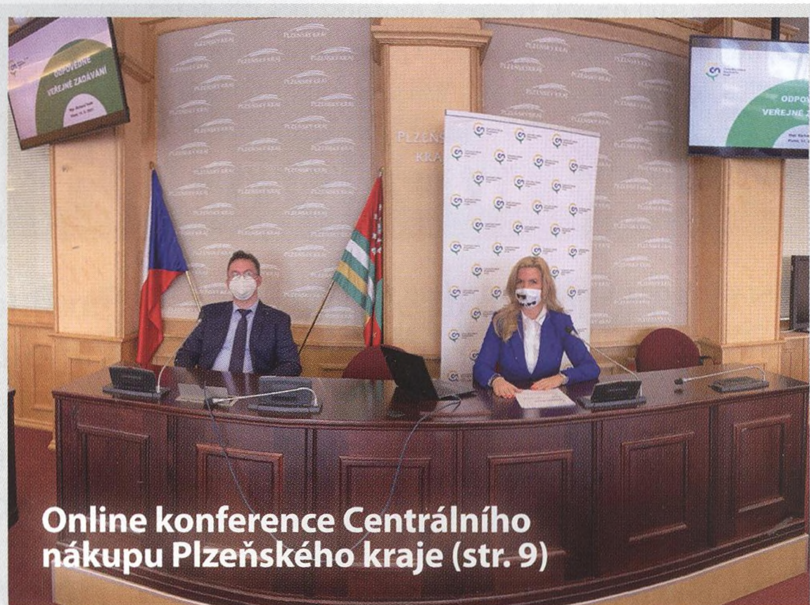
Online konference Centrálního nákupu Plzeňského kraje (str. 9)