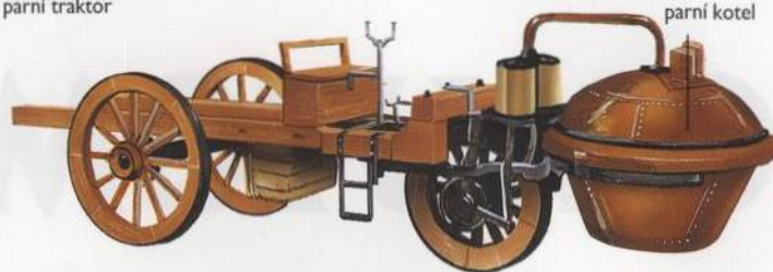
Tady má parní kotel