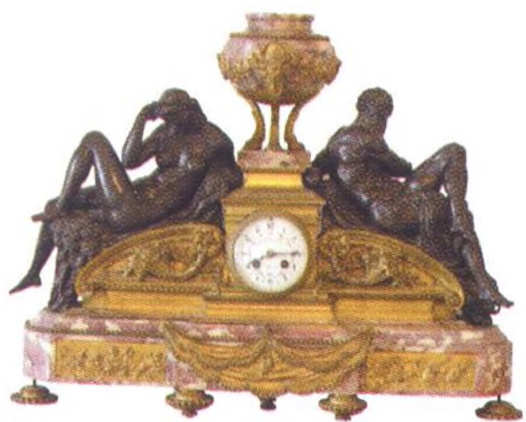
Detail v honosném Esterházyovském paláci ve Fertódu