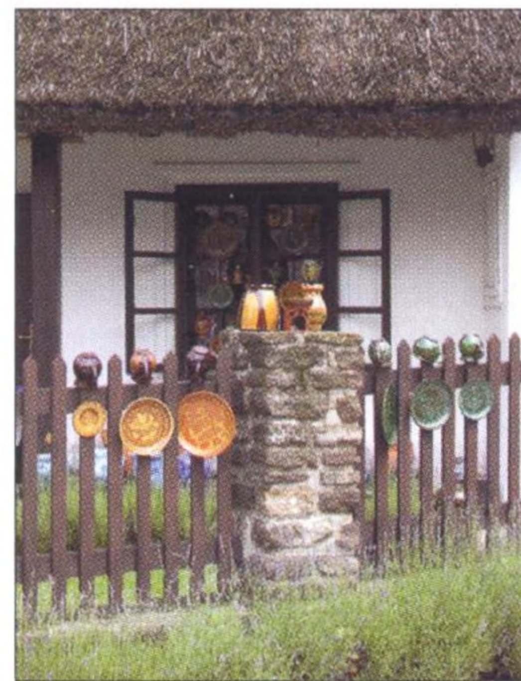
Dům s vystavenou keramikou ve skanzenu na Tihanyi