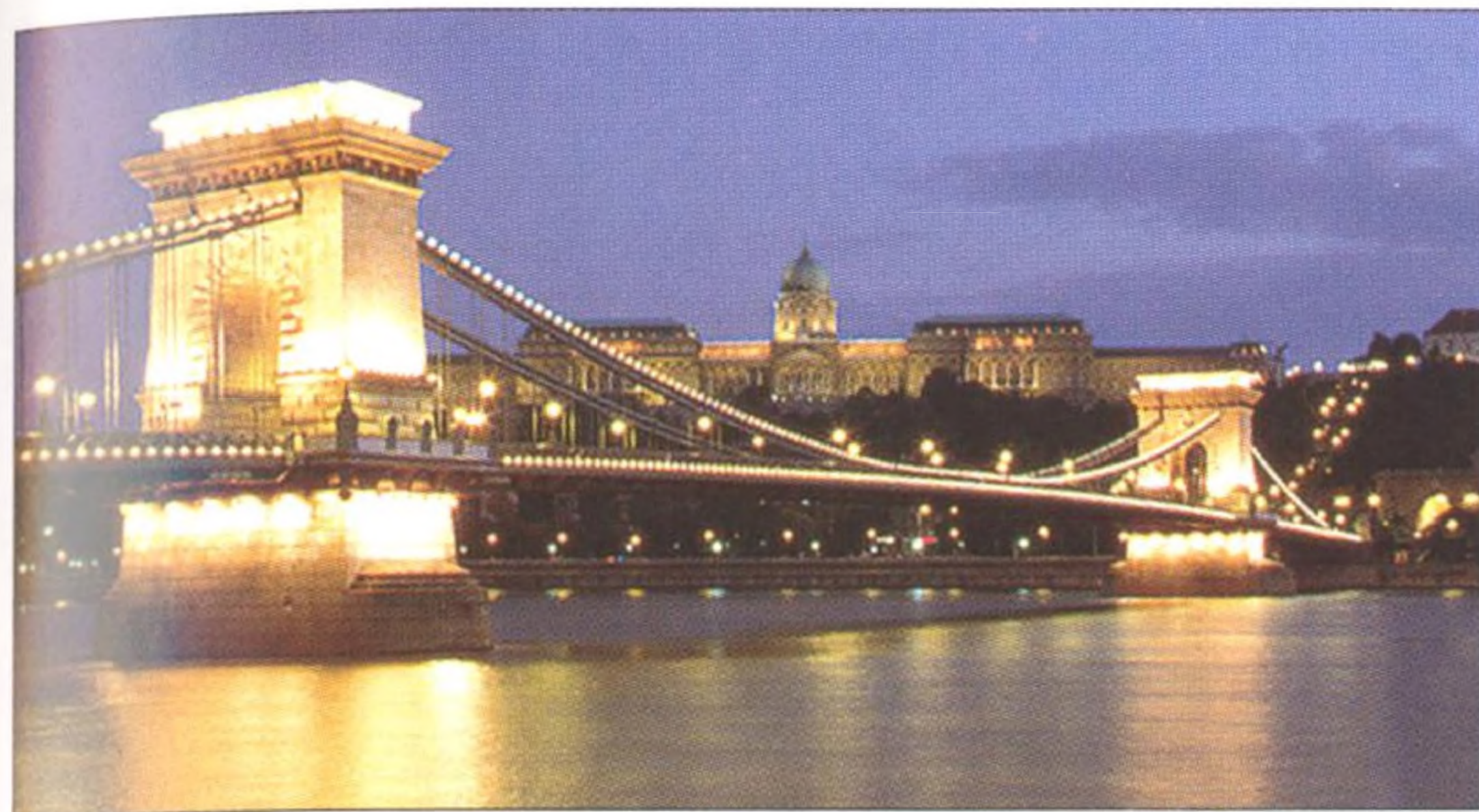
Majestátní Řetězový most spojující Budín a Pešť