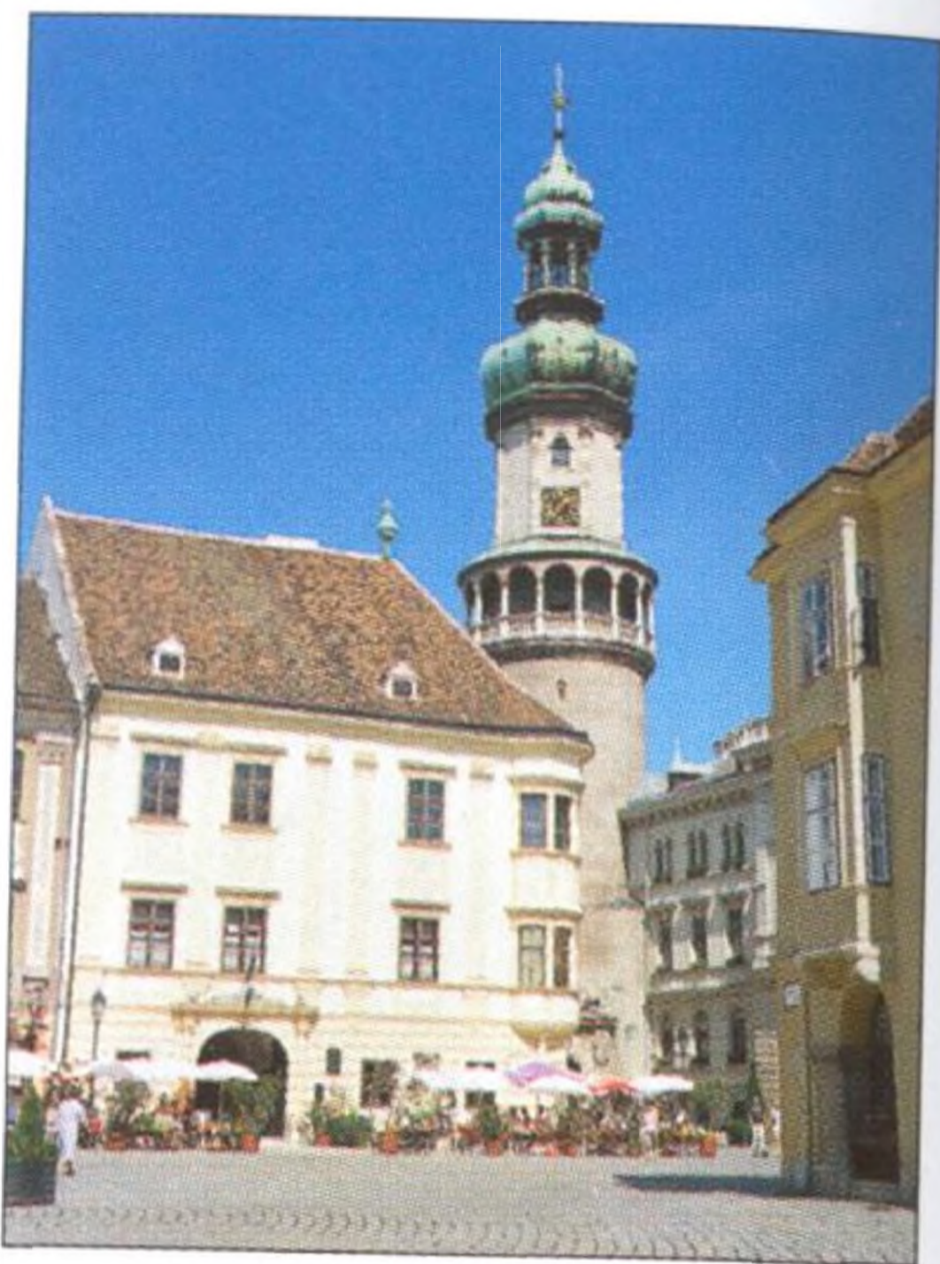
Renesanční Stornův dům a požární hláska v Šoproni