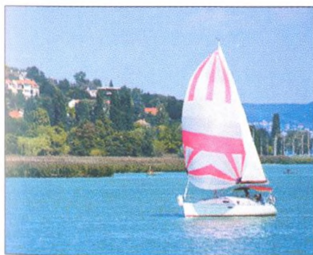
Jachta na Balatonu, největším sladkovodním jezeře v Maďarsku