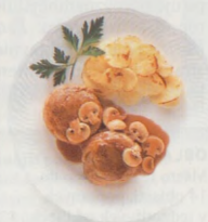
Noisettes – jehněčí kotlety