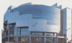
Opéra National de Paris Bastille