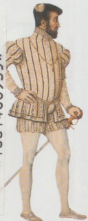
Jindřich II. (1547–59)