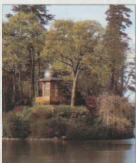
Ostrov v Buloňském lesíku