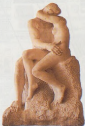
Auguste Rodin: Políbek (1886)