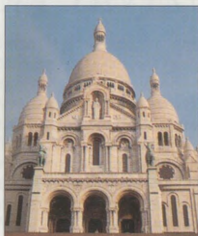
Sacré-Coeur na Montmartru