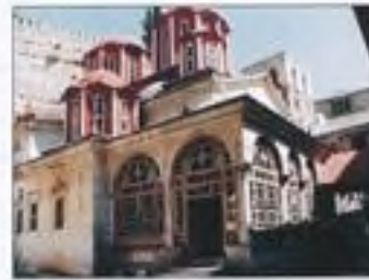
Klášter sv. Pavla na hoře Athas (Řecko)

Mezivládní organizace UNESCO v současně době určuje, která lidská díla i výtvořry přírody si zasluhují ochrany jakožto Světové kulturní dědictví.