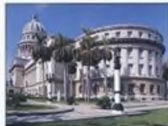
Kapitol v Havaně (Kuba)