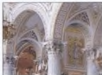
Muzeum Ermitáž (Petrohrad, Rusko)