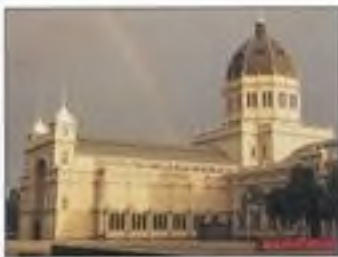
Královská výstavní budova v Melbourne (Austrálie)

S prvním pokusem o vytvoření seznamu nejúžasnějších výtvorů lidského ducha se setkáme už v klasickém starověku.