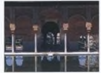
Alhambra v Granadě (Španělsko)

Tato kniha vás provede po některých nejčastěji uváděných dílech zapsaných až do současnosti na Seznam UNESCO.