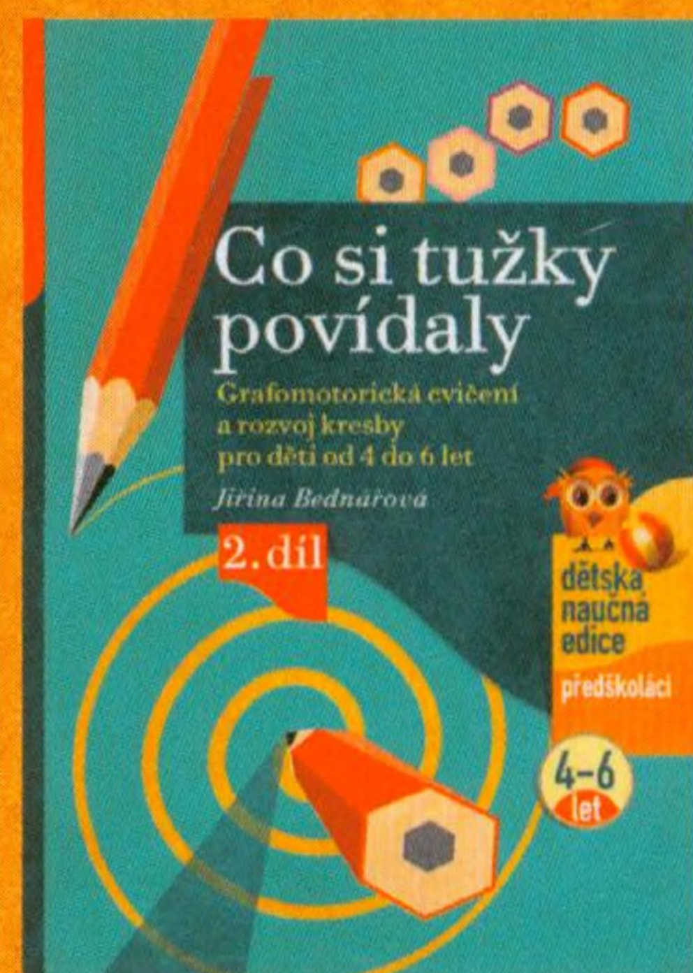
Jiřina Bednářová Co si tužky povídaly

Další knihy k rozvoji kreslení a psaní dítěte: