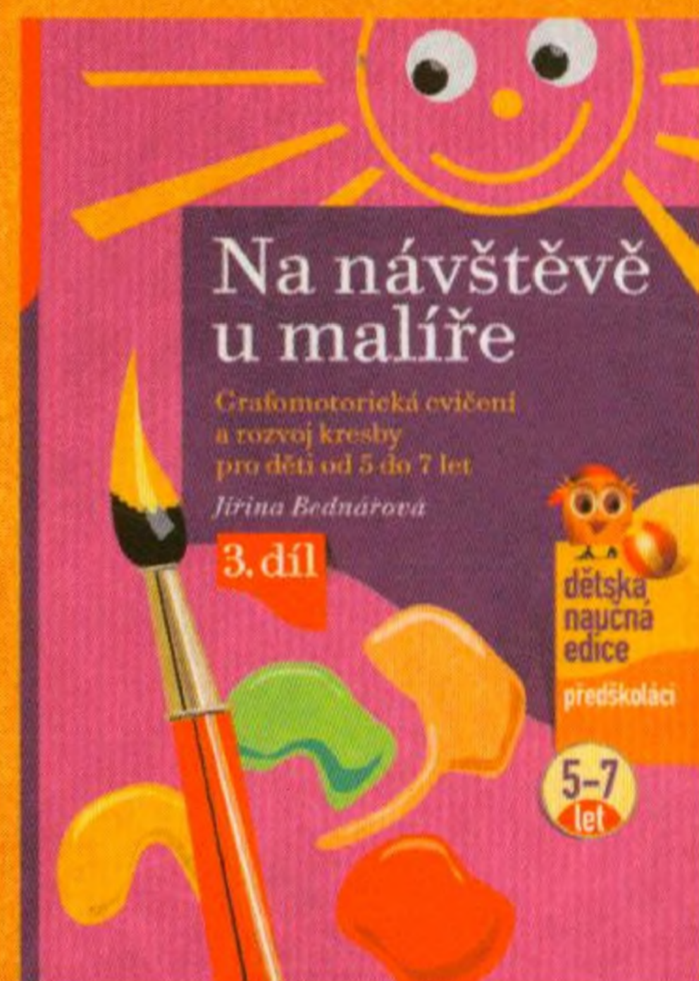
Jiřina Bednářová Na návštěvě u malíře