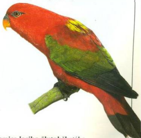
Samice ioriho žlutohřbetého