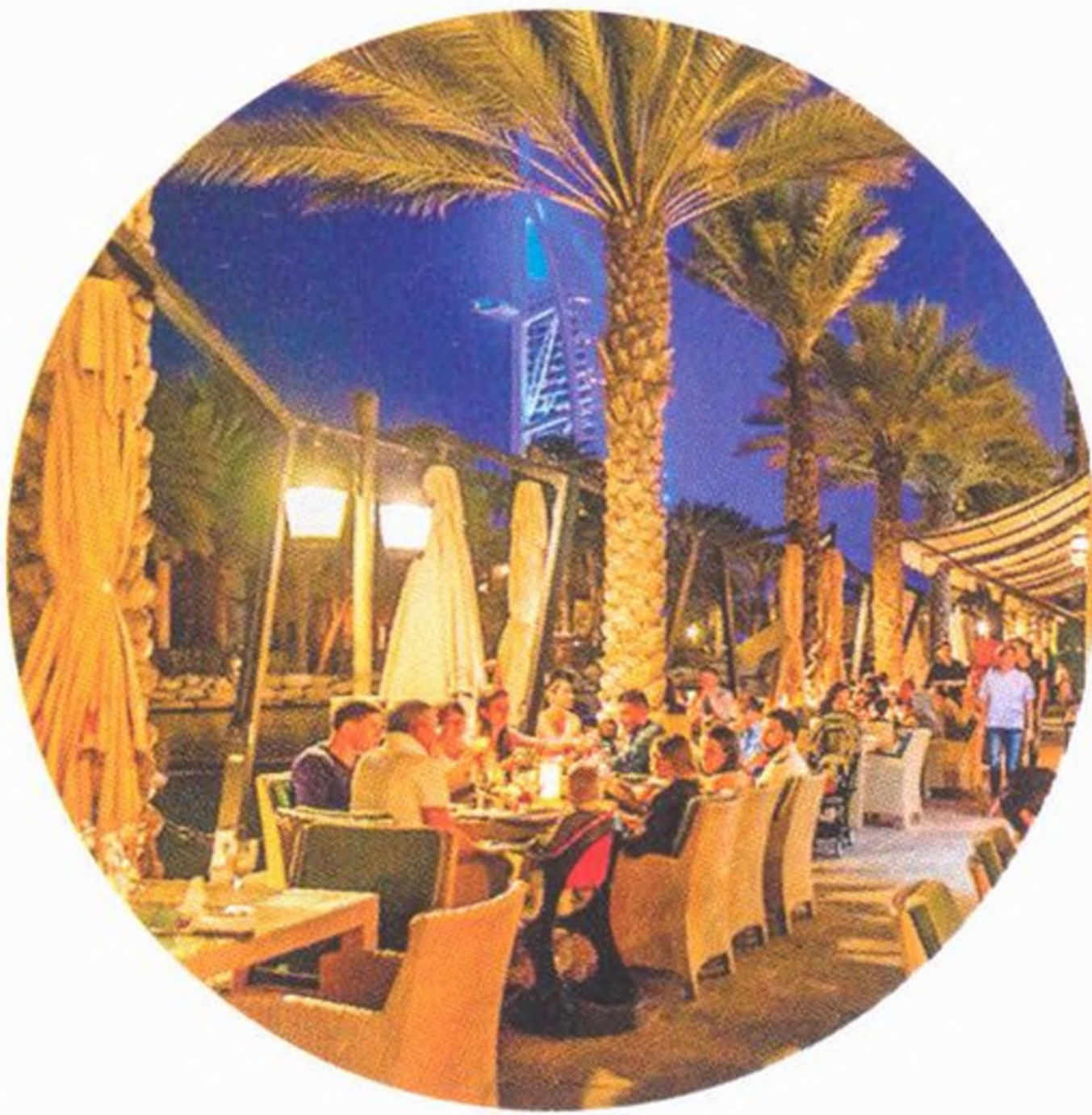
Nahoře: Madinat Jumeirah (str. 80) Dole: Historická čtvrť Al Fahidi (str. 52)