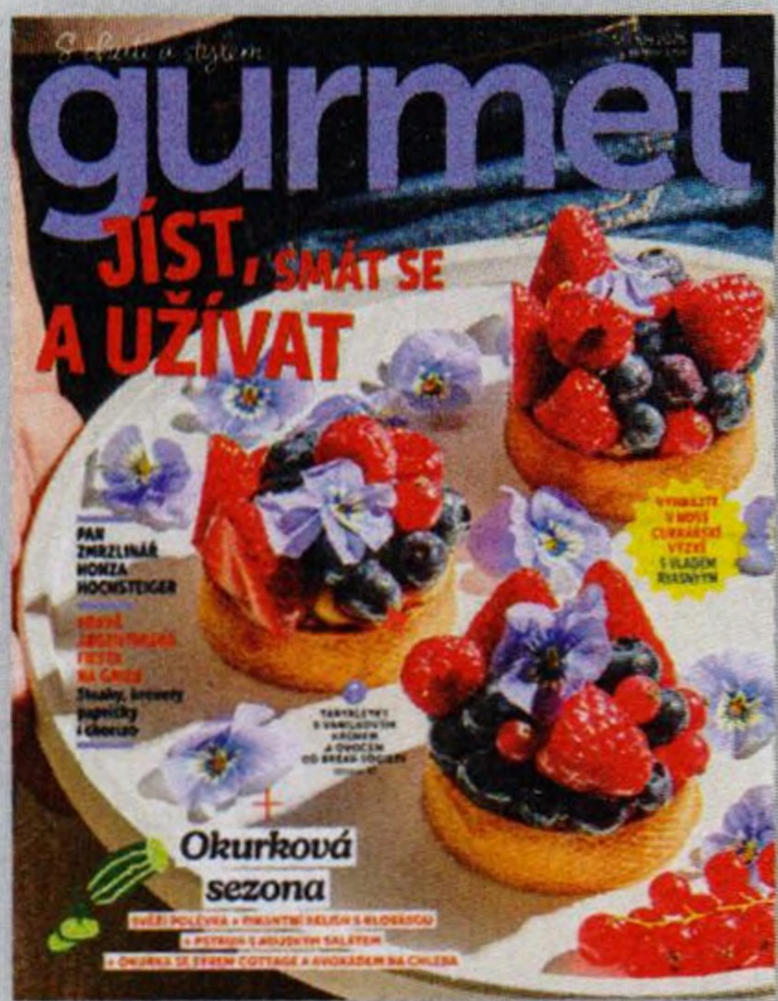
Gourmet si můžete koupit i v elektronické verzi na mojepredplatne.cz