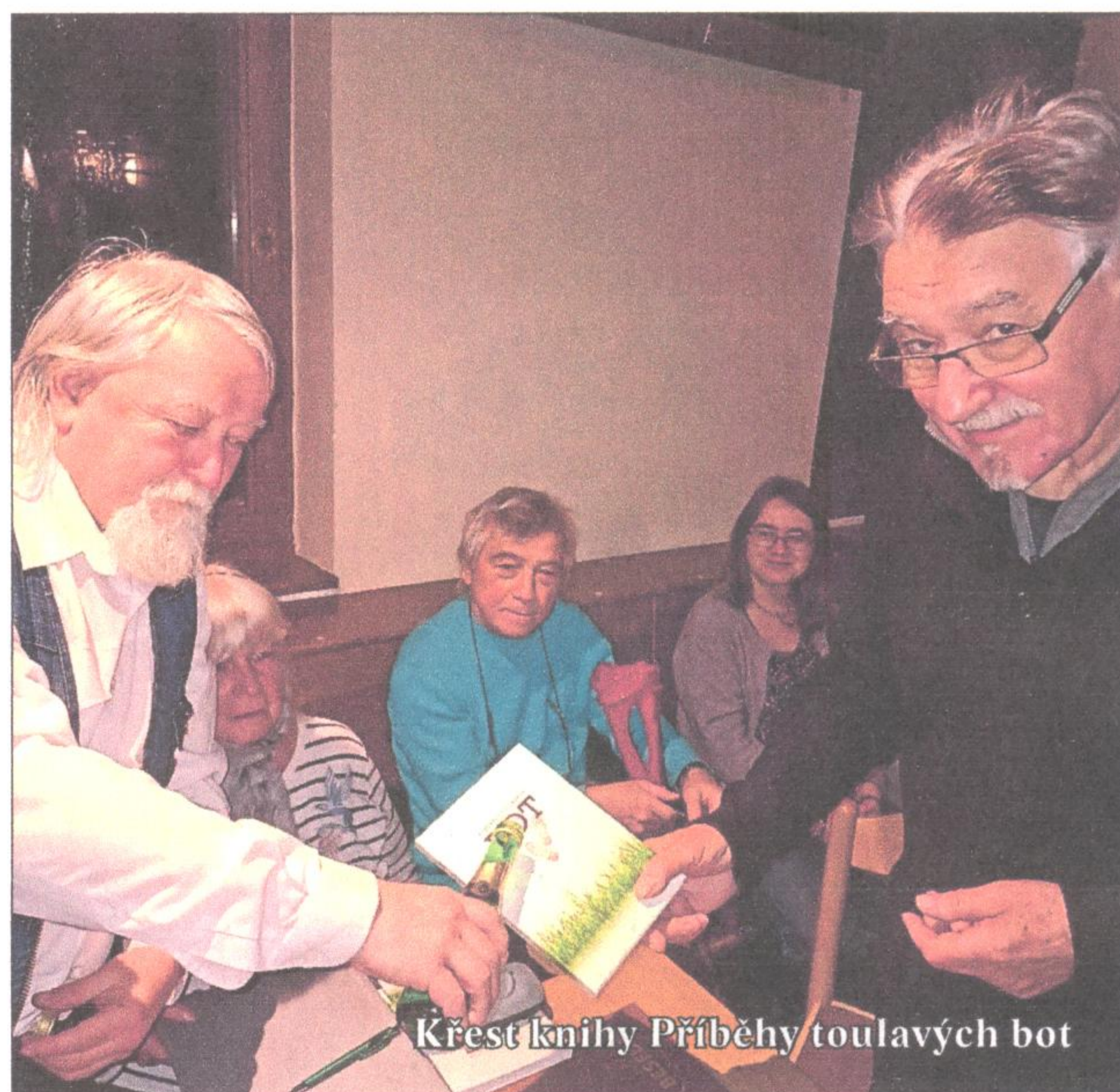
Křest knihy Příběhy toulavých bot