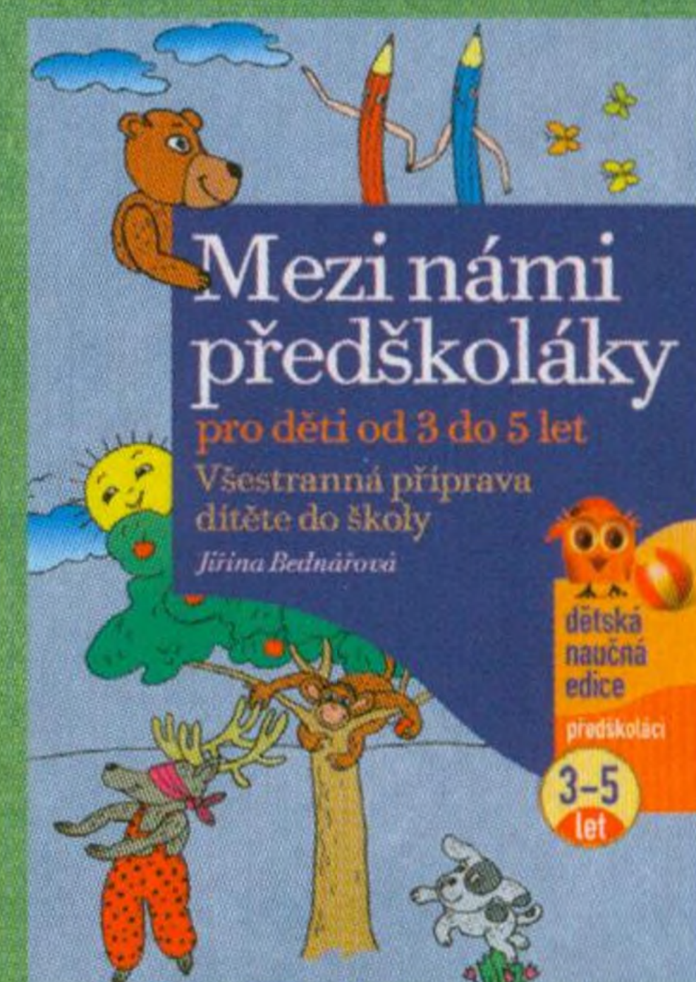
Jiřina Bednářová Mezi námi předškoláky, pro děti od 3 do 5 let

V edici Mezi námi předškoláky vyšly tyto publikace: