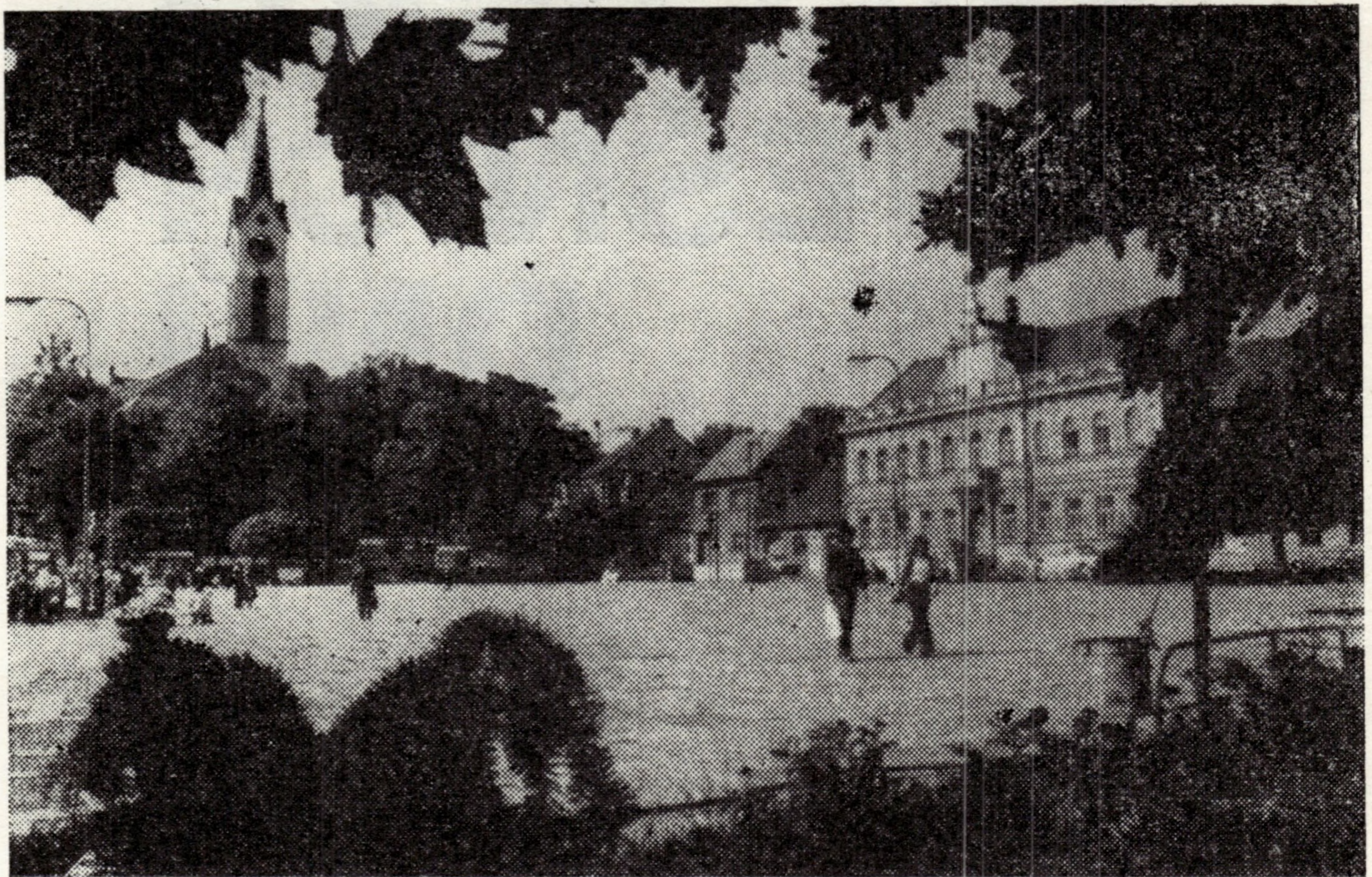
Radnice z roku 1900 — nyní sídlo Městského národního výboru.