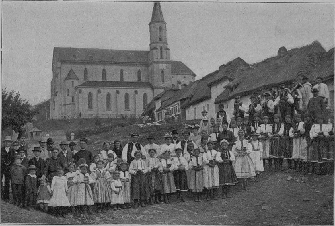
Obr. 491. Pohled na náves v Brezové u Strání.