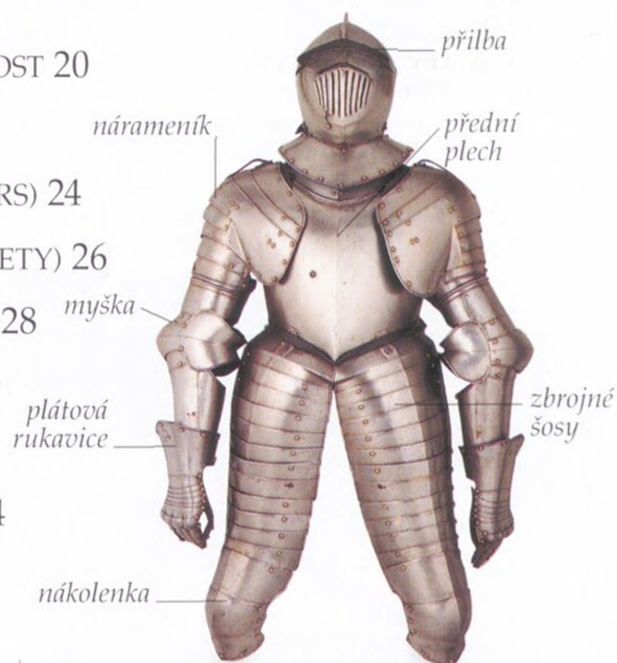
NĚMECKÁ KYRYSNICKÁ TRÍČTVRTEČNÍ ZBROJ, 17. STOLETÍ