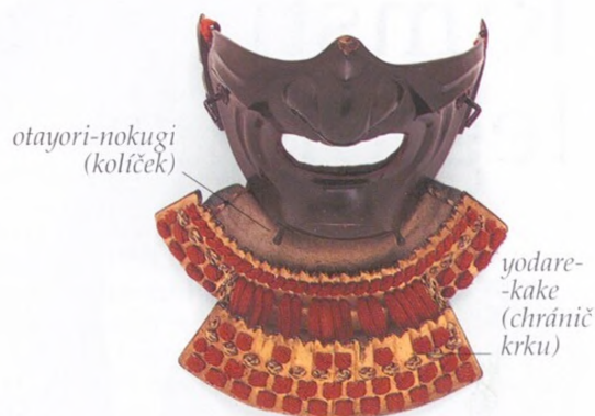
PLÁTOVÁ OBLIČEJOVÁ SAMURAJSKÁ MASKA - MEMPO, 19. STOLETÍ