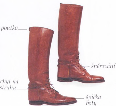
BRITSKÉ DŮSTOJNICKÉ HOLÍNKY, 1. SVĚTOVÁ VÁLKA (1914 - 1918)