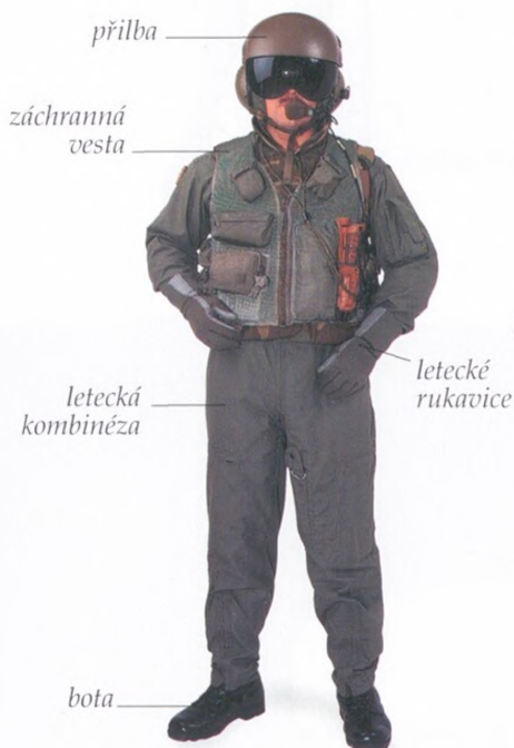
PILOT, AMERICKÁ ARMÁDA, asi 1990