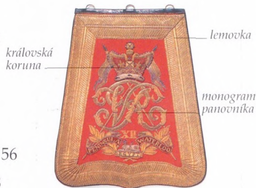
ŠAVLOVÁ TAŠKA PRO DŮSTOJNÍKA BRITSKÉHO JEZDECTVA, asi 1840