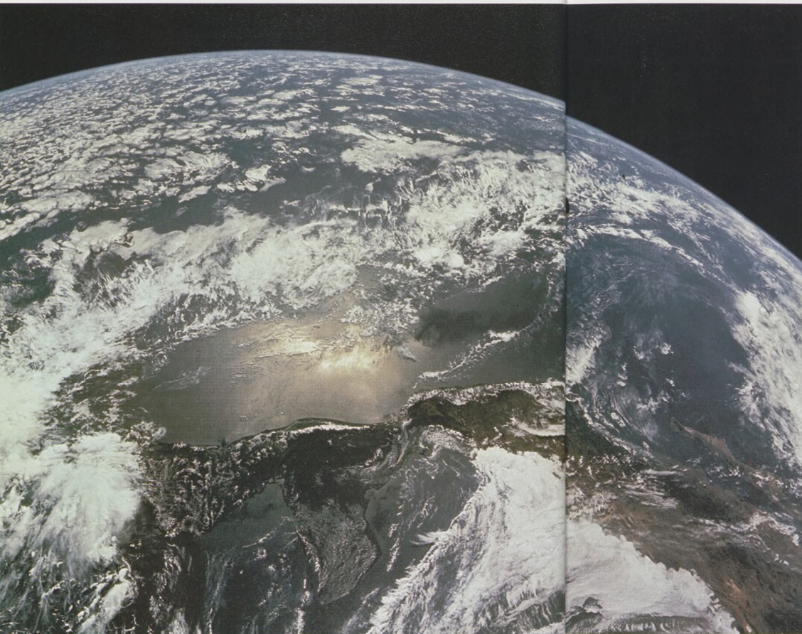
Země zahatená mraky při pohledu z Apolla 12. Vpředu oblouk Mexika a Střední Ameriky.