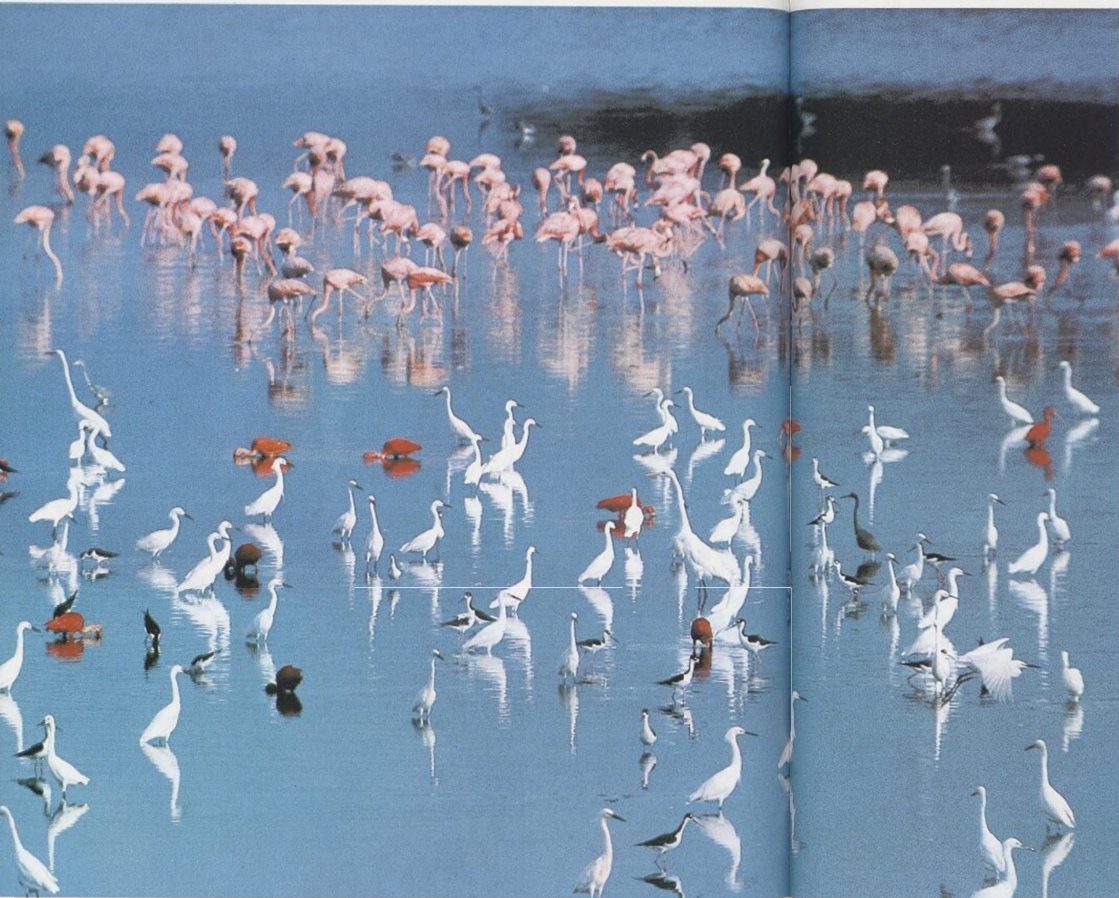
Plameňáci, ibisové nachosi, volavky a další brodíví ptáci se na venezuelském jezírku dělí o hojnost potravy.