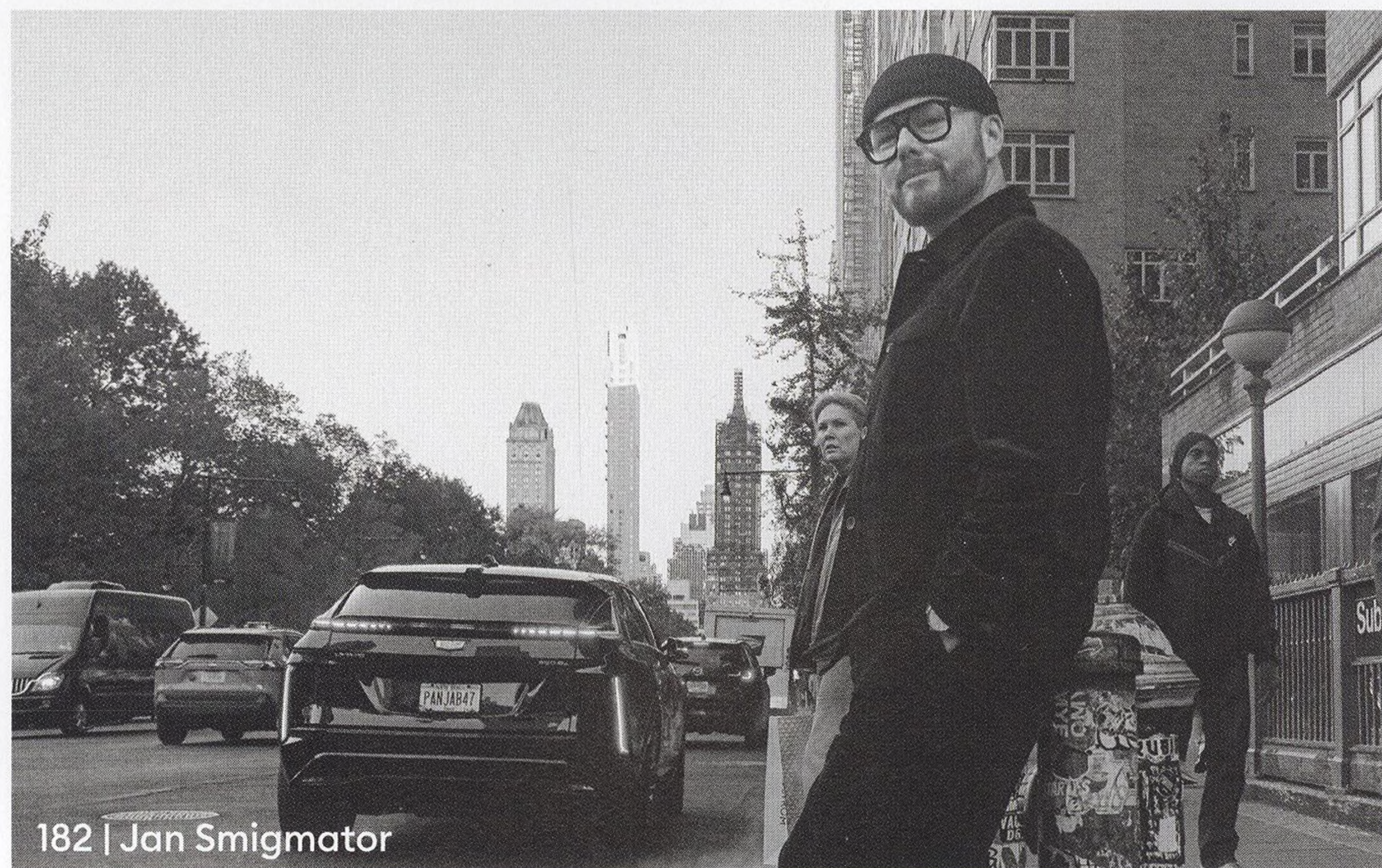
182 | Jan Smigmator