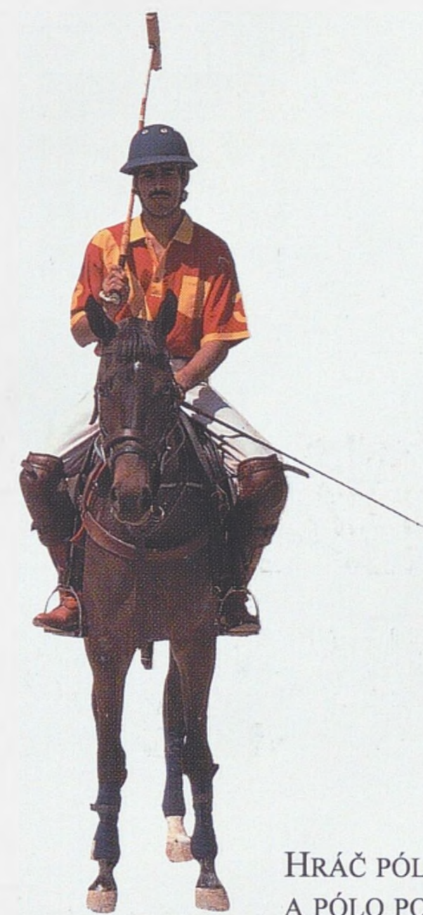
HRAČ PÓLA A PÓLO PONY