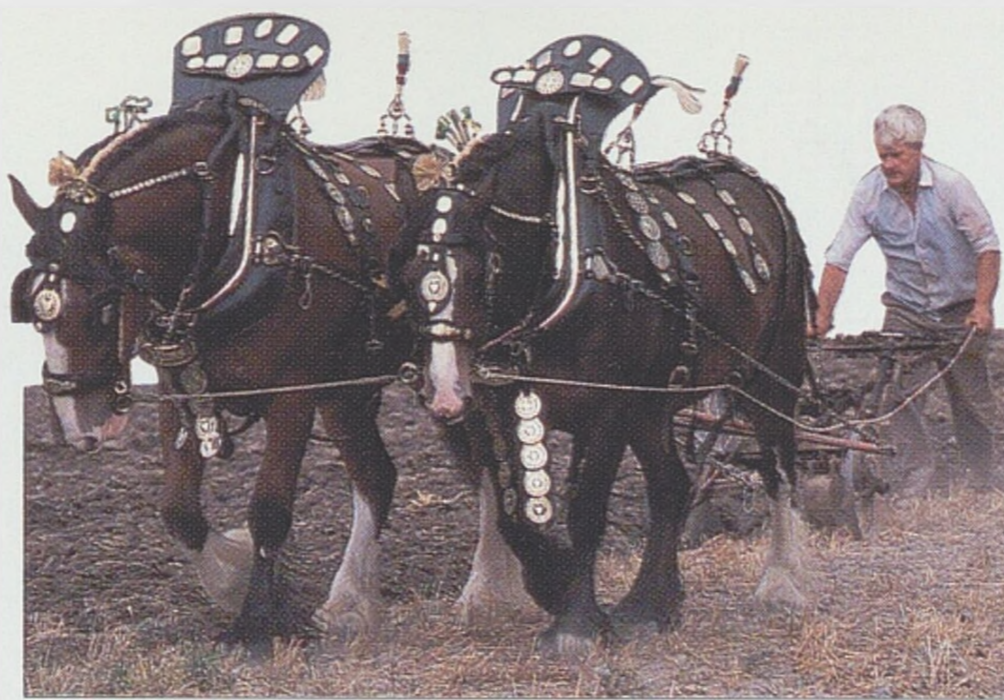
ORAJÍCÍ SHIRŠTÍ KONĚ