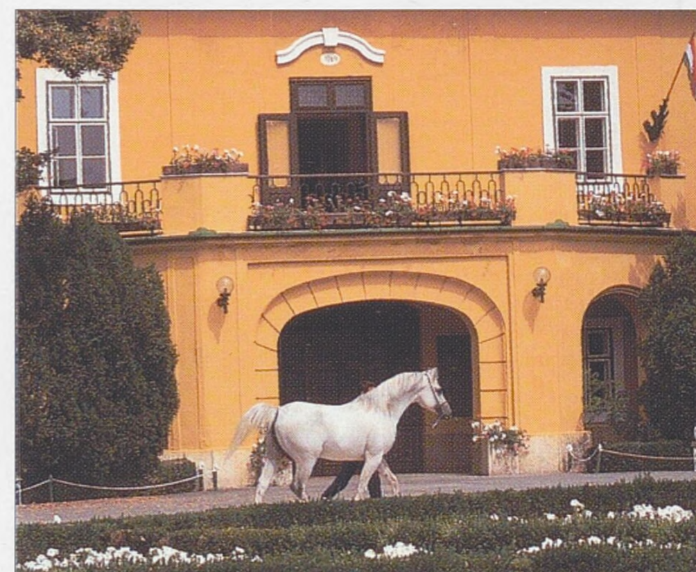
HŘEBČÍN V BÁBOLNĚ, MAĎARSKO

HŘEBČINY SPOJENÉHO KRÁLOVSTVÍ, IRSKA A SPOJENÝCH STÁTŮ 116 Anglický plnokrevník 118 ♦ Shaleský kůň 120 VZESTUP TEPLOKREVNÍKŮ 122 Groningen & gelderlander 124 Holandský teplokrevník 126 ZÁPADOEVRÓPSKÉ ÚSTAVY PRO CHOV KONÍ 128 Francouzský jezdecký kůň 130 Francouzský klusák 132 Einsiedler & freiberger 134 STŘEDOEVRÓPSKÉ HŘEBČINY 136 Trakénský kůň 138 ♦ Holštýnský kůň 140 Hannoverský kůň 142 Belgický & bavorský teplokrevník 144 Rýnský & württemberský teplokrevník 146 Dánský & švédský teplokrevník 148 VÝCHODOEVROPSKÉ HŘEBČINY 150 Velkopolský kůň 152 ♦ Nonius & Furioso 154 Český & slovenský teplokrevník 156 VÝCHODNÍ HŘEBČINY 158 Kathiawari 160 ♦ Marwari 162 Indický polokrevník 164