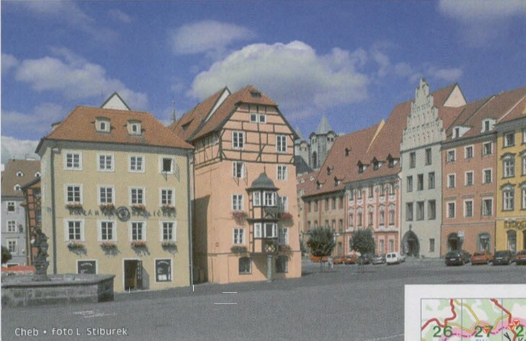
Cheb • foto L. Stiburek