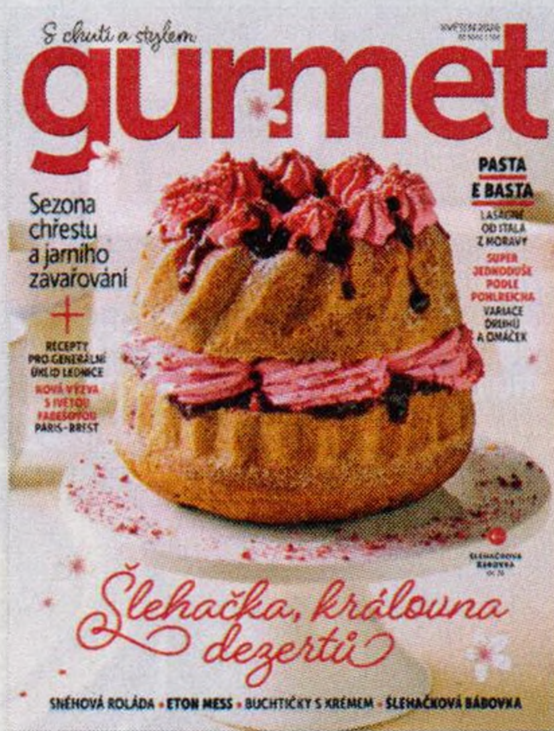
Gourmet si můžete koupit i v elektronické verzi na mojepredplatne.cz