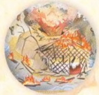
Hóří! strana 24