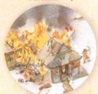
Dobytí Mongoly strana 14