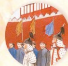
Návštěvníci z Evropy strana 28