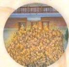
Pád Mingů strana 26