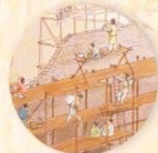
Budování Čung-tu strana 10