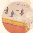
Život v paláci strana 22