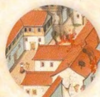
Povstání Boxerů strana 32