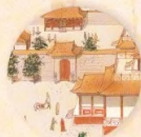
Ťínský palác strana 12