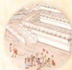
Město – muzeum strana 40