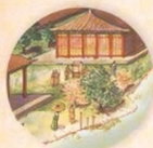
Chubilajchánovo město strana 16