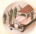
Nový věk strana 36