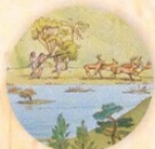
Život v bažině strana 6