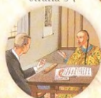
Poslední císař strana 34