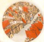
Kulturní revoluce strana 38