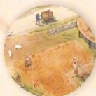
Obdělávání půdy strana 8

Tato kniha sleduje historii města, které dnes známe jako Peking. Představí vám různá palácová města: jak se budovala, zvětšovala, jak byla napadena nebo dokonce zničena. Budete také svědky rozvoje ohromujícího uzavřeného místa, Zakázaného města, a půjdete po stopách jeho historie až po současnost.