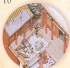
Zakázané město strana 20