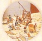
Dobytí Mingů strana 18