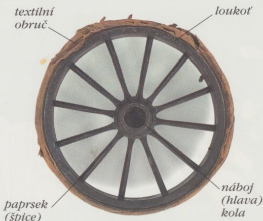
LOUKOŤOVÉ KOLO (KOLO S DŘEVĚNÝMI PAPSKY)