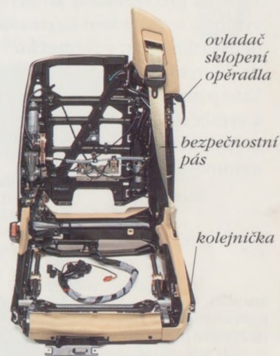
ELEKTRICKY NASTAVOVANÉ, POČÍTAČEM OVLÁDANÉ SEDADLO