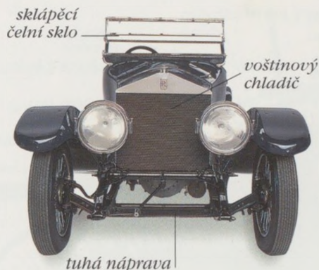
CESTOVNÍ ROLLS-ROYCE SILVER GHOST, 1913