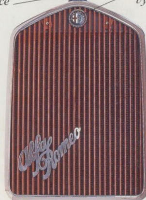
CHLADIČ A MASKA ALFY ROMEO