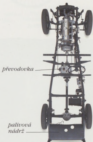
PODVOZEK LANCHESTER, 11/13 KW (15/18 k), 1932